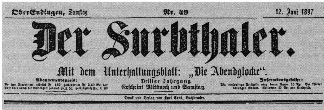
Titel des Surbталers vom 12. Juni 1897.