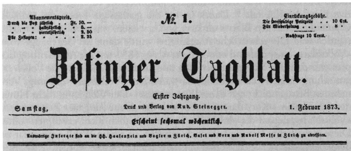
Die erste Nummer des Zofinger Tagblatts vom 1. Februar 1873.