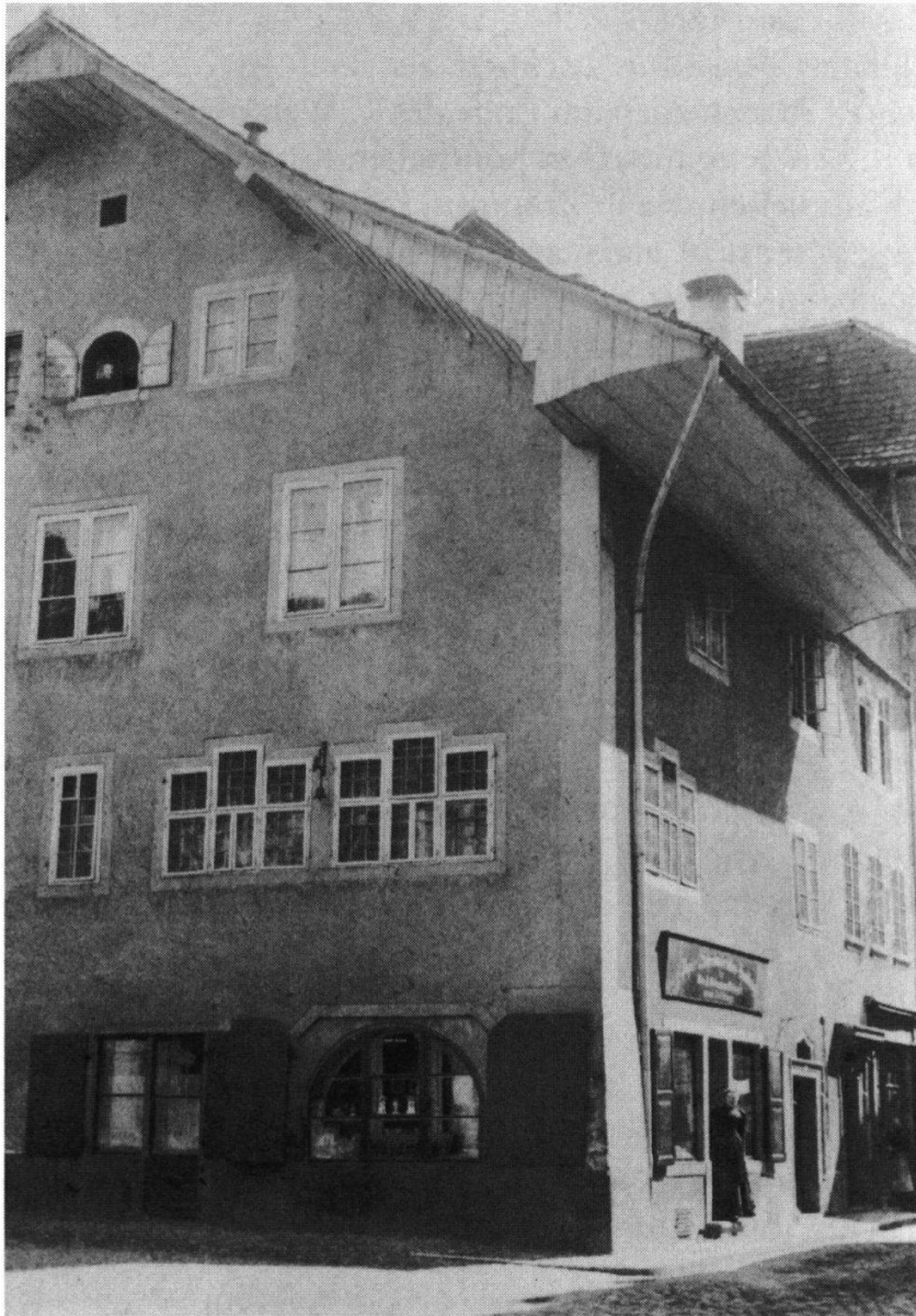
Das Haus zum Pfauen, wo das erste Zofinger Tagblatt entstand.