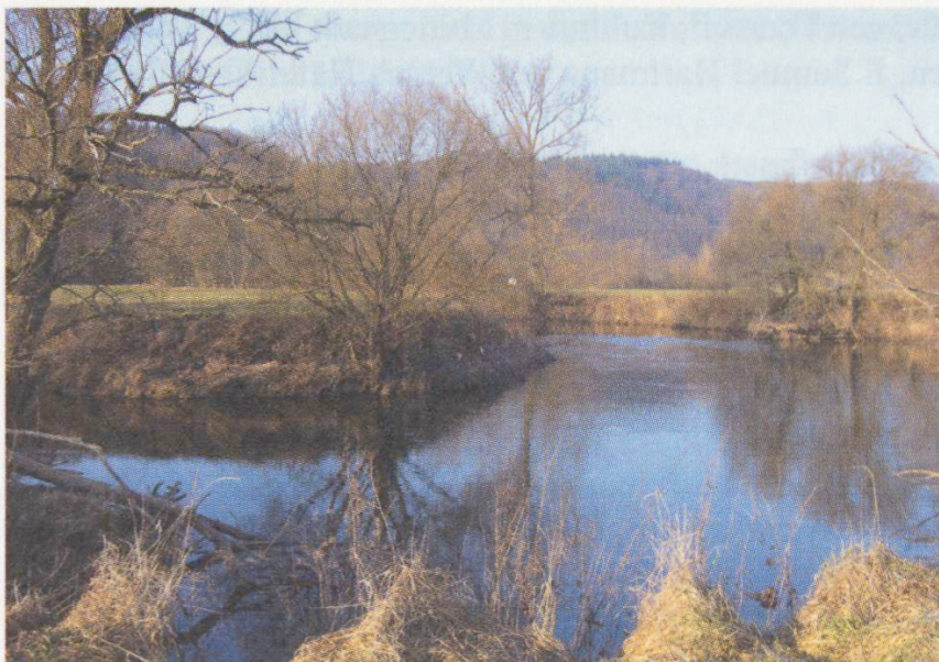
Idyllisches Bild an der Blies, die dem Bliesgau den Namen gegeben hat. Sie gehört heute zu den schönsten und naturnahsten Fließgewässern Südwestdeutschlands.