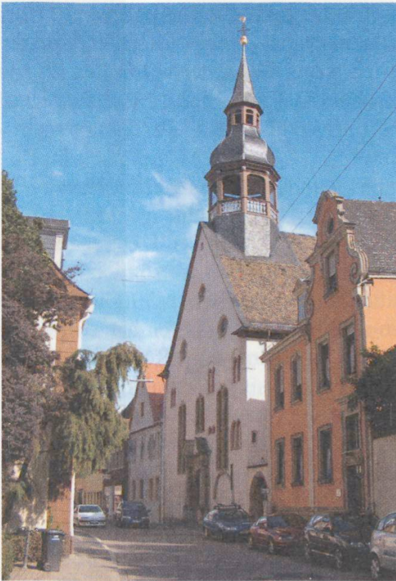
Speyer, die 1700–1702 für die Reformierten erbaute Heiliggeistkirche