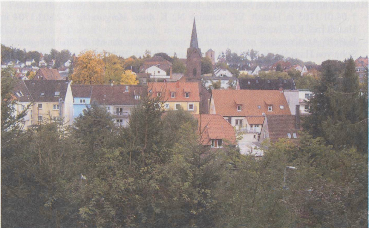
Waldfishbach am Westrand des Pfälzer Waldes