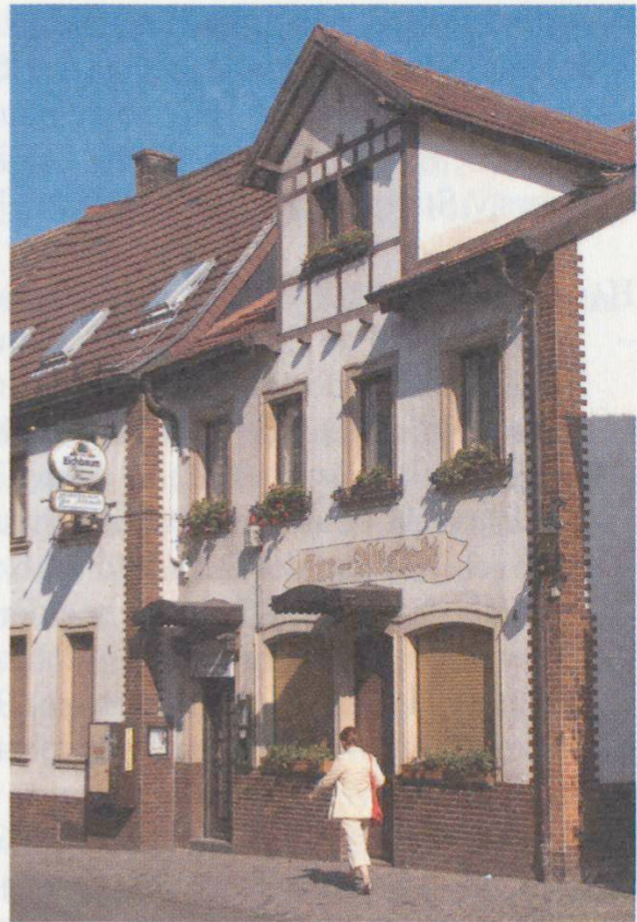
Dürkheim, ältestes erhaltenes Wohnhaus