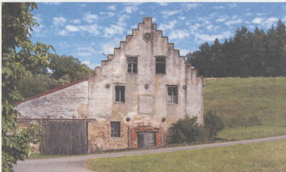
Altes Gebäude im Bickenaschbacherhof (entspricht dem Haus ganz links auf dem Bild auf S. 242 oben)