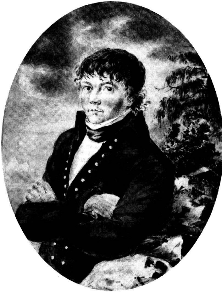
Heinrich Zschokke (1771–1848) als Regierungsstatthalter in Basel 1800/01, unbekannter Maler.

fers. 21 Der von ihm in der Planung gesetzte Zweck wird hier folgendermassen umschrieben: