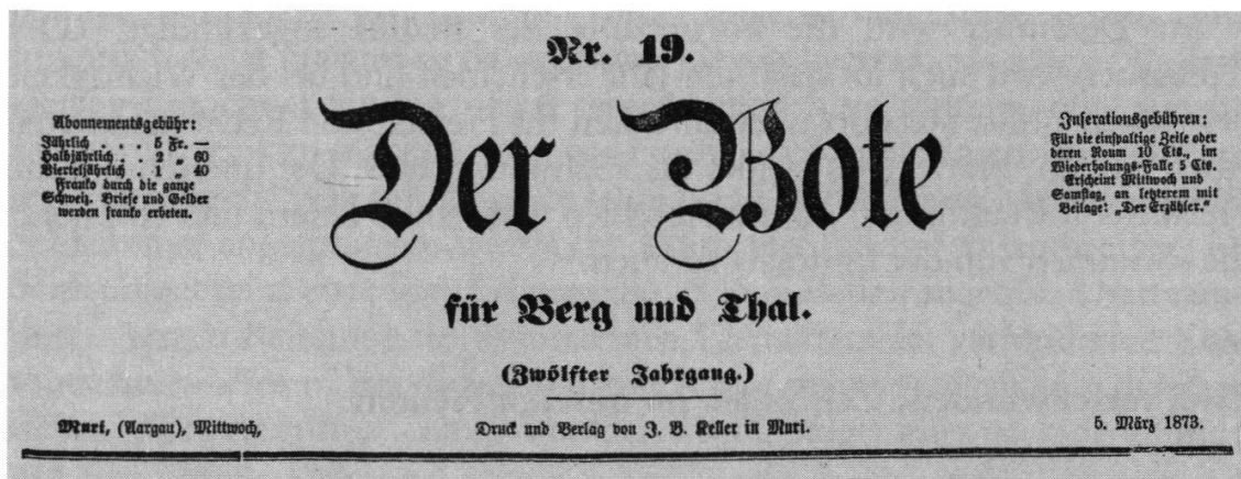
Titel des Boten für Berg und Thal aus dem Verlag Keller in Muri.