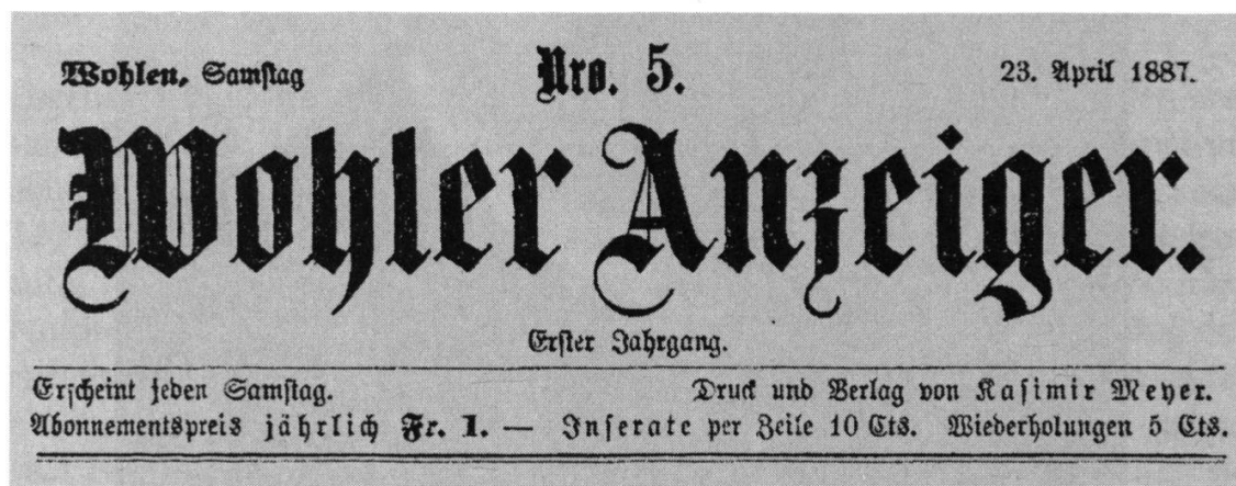
Kopf des Wohler Anzeiger vom 23. April 1887 (Druckerei Meyer, Wohlen).