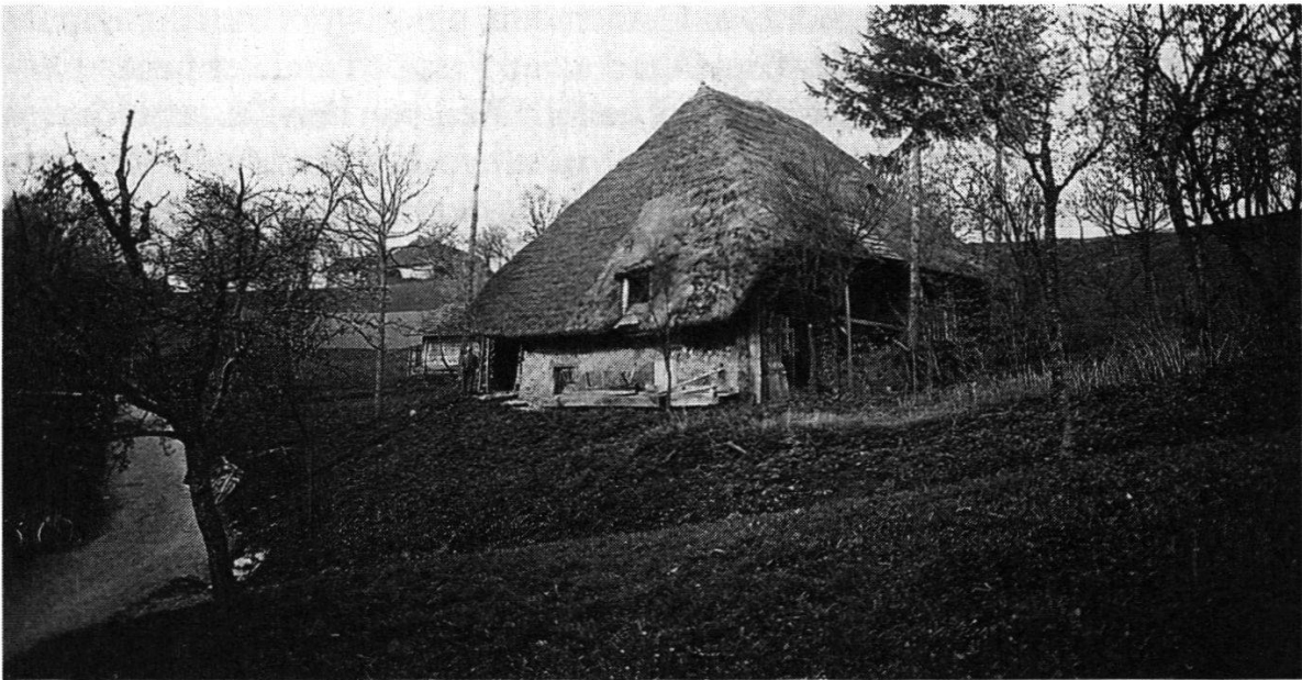
49 In solch abgelegenen Bauernhöfen konnten sich die österreichischen Flüchtlinge gut versteckt halten. Ob sie sich allerdings bis in den Bezirkshauptort vorwagten, ist nicht überliefert. Das Haus in der Unterkulmer Heurüti stand bis 1946 .