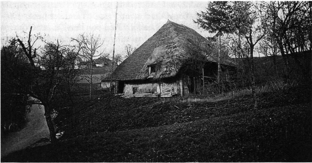
49 In solch abgelegenen Bauernhöfen konnten sich die österreichischen Flüchtlinge gut versteckt halten. Ob sie sich allerdings bis in den Bezirkshauptort vorwagten, ist nicht überliefert. Das Haus in der Unterkulmer Heurüti stand bis 1946.