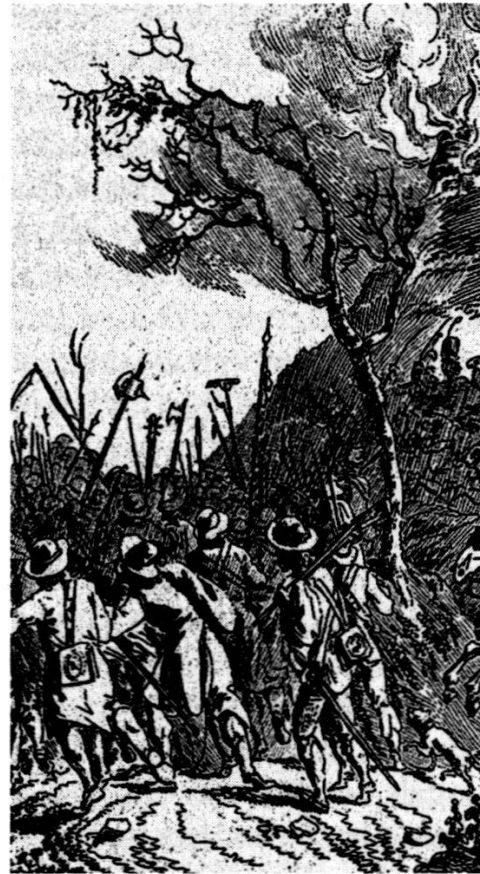
47 Ganz ähnlich wie auf diesem Landsturm-Bild mag es bei den Sturmläufern aus dem Oberwynental ausgesehen haben. Neben Hellebarden und Morgensternen sind als Waffen Heugabeln und Sensen sichtbar. Aus der Heinzmann-Chronik.