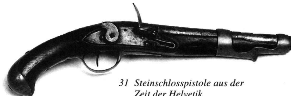
31 Steinschlosspistole aus der Zeit der Helvetik

Interessant ist auch der Vergleich der Gesamtsoldatenzahl mit der überkommenen bernischen Wehrorganisation. Im Sommer 1798 hatten die helvetischen Behörden die Wehrpflichtigen nochmals gezählt. Im Bezirk Kulm war der Unterstatthalter auf 2718 Mann gekommen, also auf 600 Leute mehr 198 . Das lag einmal daran, dass man jetzt auf die jüngsten Jahrgänge verzichtete und dass 30 Mann schon in die Legion eingezogen worden waren. Vermutlich hatte man bei der Aufnahme im Sommer auch untaugliche Leute mitgerechnet. Ein wesentlicher Grund für die Zahlendifferenz war aber auch, dass sich inzwischen mancher Kulmer aus dem Staub gemacht hatte, um der Aushebung zu entgehen (Kap. III/8).