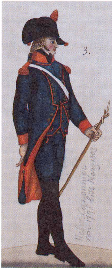
33 helvetischer Kanonier