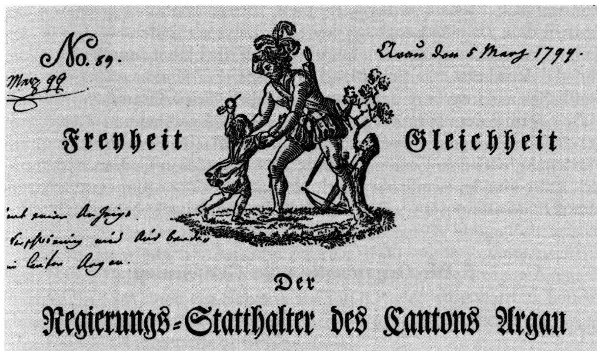
13 Amtlicher helvetischer Briefkopf. Als schmückendes Sujet wurde – wie auch für die staatlichen Siegel – mit Vorliebe Tells Apfelschuss verwendet. Es waren verschiedene zeichnerische Varianten in Gebrauch.