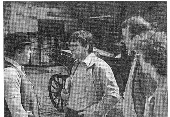
Schulbesuchstage einmal anders

Die Schüler des Schulhauses Petermoos kamen über Auffahrt zu einem verlängerten Wochenende. Grund: Sämtliche Lehrer sowie Vertreter der wissenschaftlichen Begleitung verbrachten einige Tage in Wien. Ziel war eine österreichische Gesamtschule, welche in ihrer Anlage viel Gemeinsamkeiten mit dem AVO aufweist. Ebenso ähnlich sind aber auch die Probleme, mit denen die österreichischen Versuchslehrer zu kämpfen haben. Neben den Schulbesuchen blieb noch genügend Zeit, um Grinzing, Prater und Kärntnerstrasse zu geniessen.