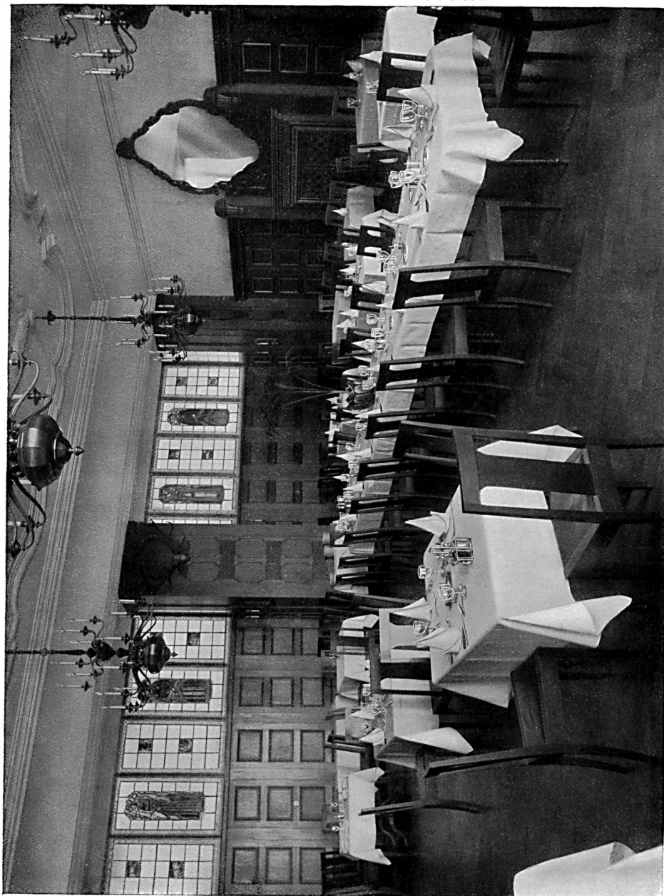
Le restaurant de l'Hôtel central à Lausanne. — Architecte : J. Austermeier, Lausanne.