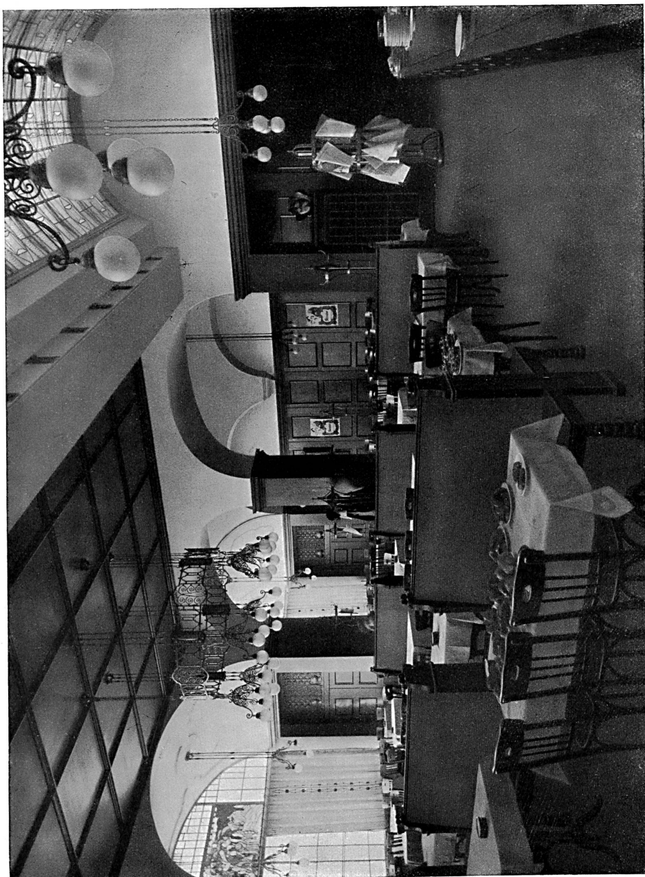
Le restaurant de l'Hôtel central à Lausanne. — Architecte : J. Austermeier, Lausanne.