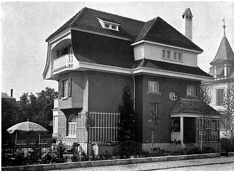
Maison de Monsieur W. Kern-Fueter à Berne. Architectes : Nigst & Padel, Berne.

REVUE BI-MENSUELLE D'ARCHITECTURE, D'ART, D'ART APPLIQUÉ ET DE CONSTRUCTION