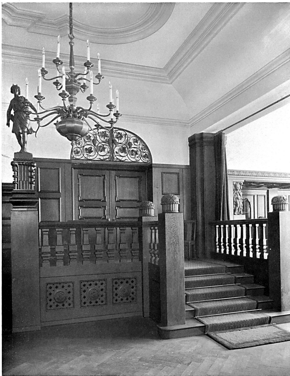
Partie de l'entrée du restaurant de l'Hôtel central, à Lausanne. — Architecte : J. Austermeier, Lausanne.