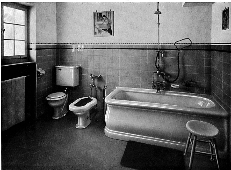
Chambre de bains d'une villa à Zurich. Architectes: Marfort et Merkel, Zurich.