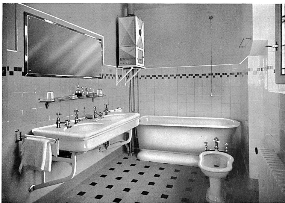
Chambre de bains d'une villa à St-Gall.

parce qu'elle permet de ne pas se mouiller les cheveux, l'autre à main pour enfants.