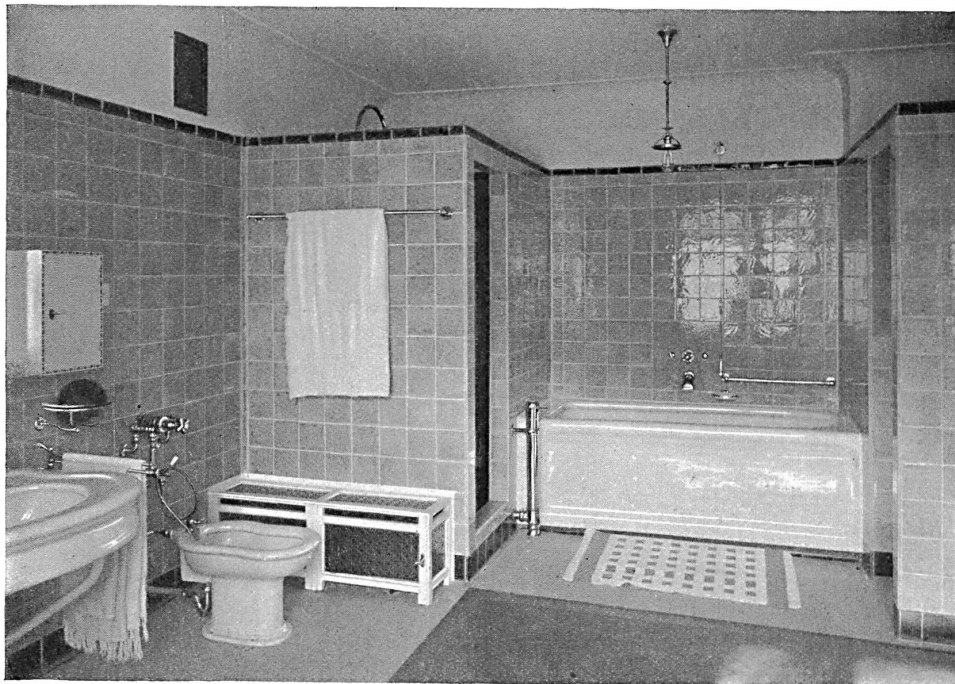
Chambre de bains; baignoire en grès émaillé; à gauche douche; à droite W. C.