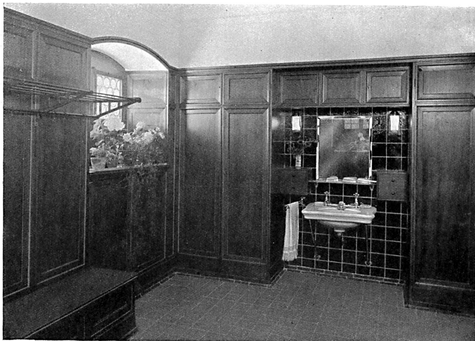
Gardrobe avec toilette en grès émaillé. Château de Heerbrugg (canton de St-Gall) à M. J. Schmidheiny. Architectes: Curjel et Moser, Zurich.