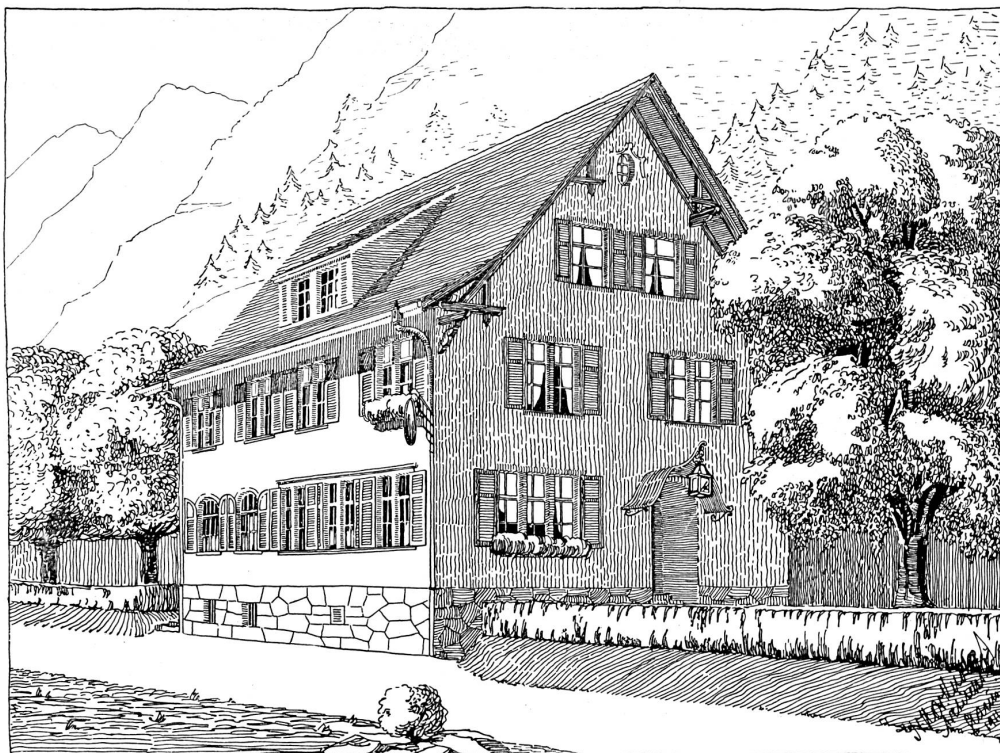
Vue perspective d'après un dessin à la plume de l'architecte.