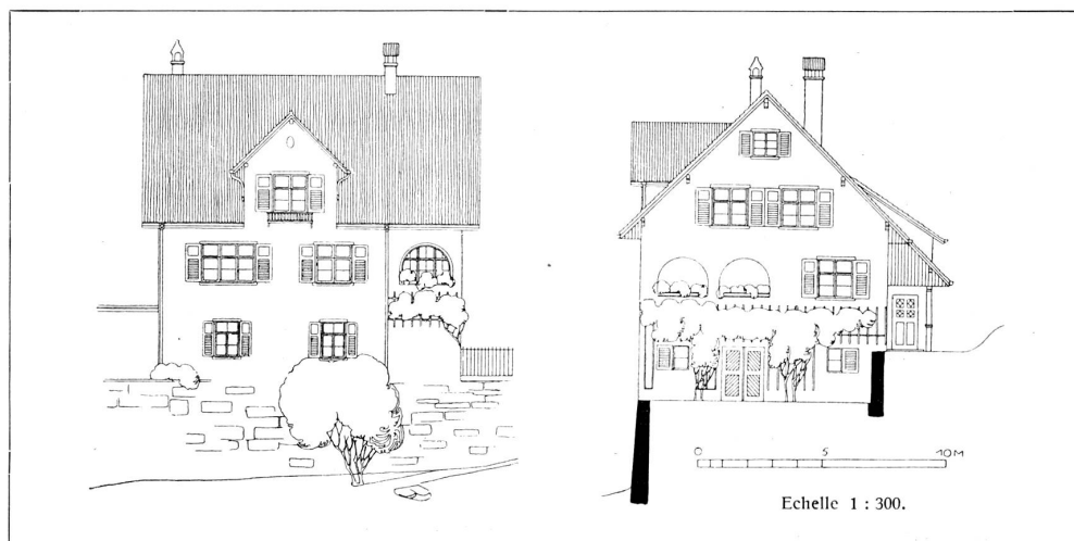
En haut: Maison de campagne près de Berne. — En bas: Façades de la maison de M. Hösli-Kubli à Ennetbühl près Glaris.