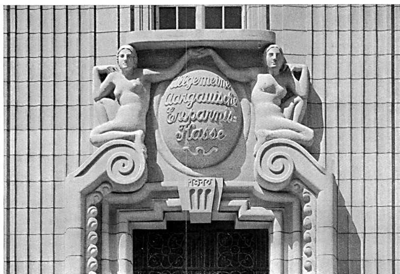
Porte d'entrée de la Caisse d'Epargne argovienne à Aarau. Sculptures de Kappeler, Zurich.

Les articles et les planches ne peuvent être reproduits qu'avec l'autorisation de l'éditeur.