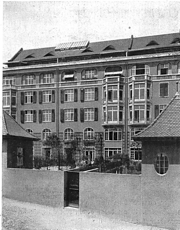
Groupe d'immeubles «Am Viadukt» :: Façade sur les jardins, Pelikanweg 3, 5, 7

L'idéal consisterait à réunir les avantages de ces deux genres d'habitation. Il faudrait pou-