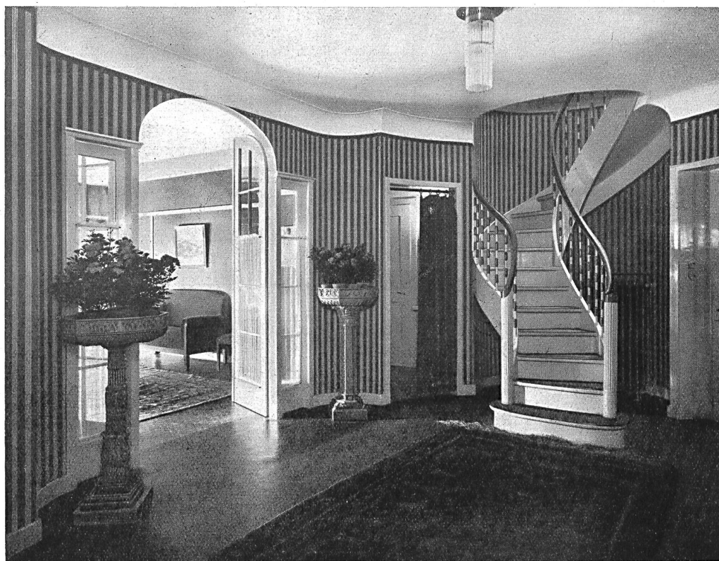
Hall au rez-de-chaussée avec escalier intérieur conduisant à l'entresol

La division des locaux en trois parties bien distinctes, chambres de réception, chambres à cou-