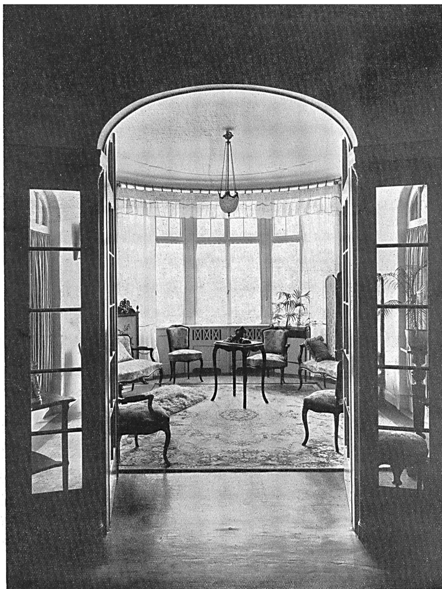
:: Le salon, vue du hall :: Tiergartenrain n° 1, 1 er étage