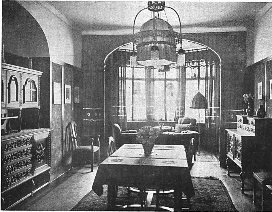
Salle à manger avec fumoir attenant au 1 er étage