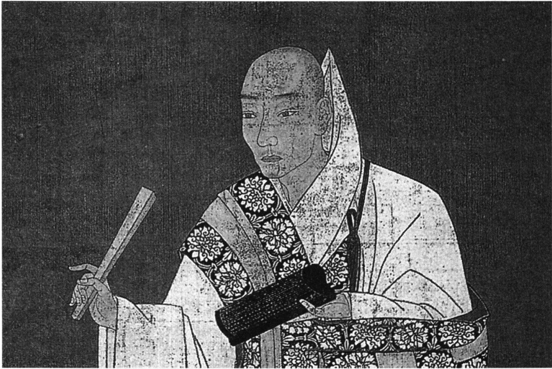
Abb. 2: Detail aus Hasegawa Tôhaku (1539-1610), Nichigyô Shônin .