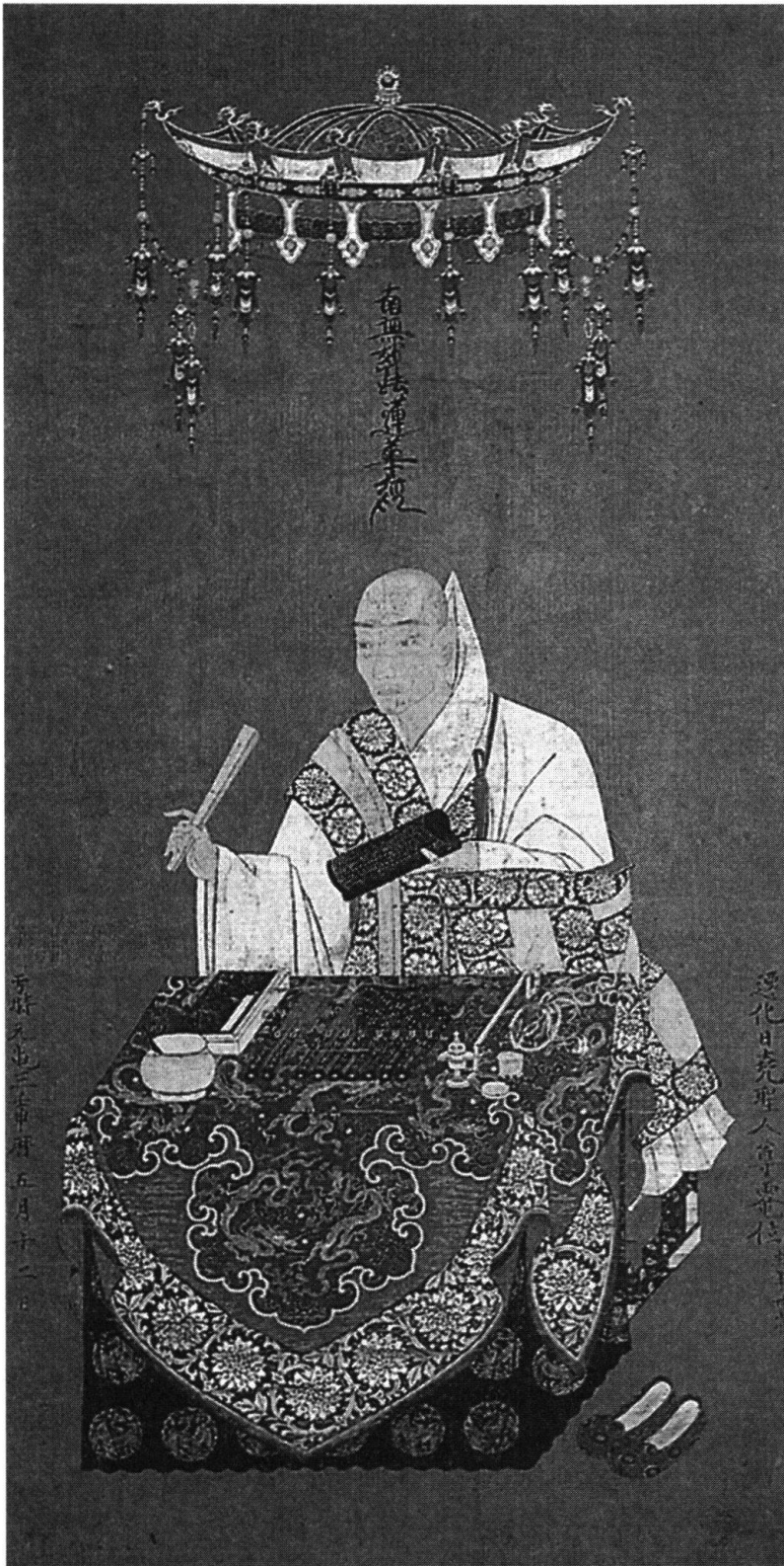
Abb. 1: Hasegawa Tôhaku (1539-1610), Nichigyô Shônin , dat. 1572, Hängengerolle, Tusche und Farben auf Seide, 98,2 x 49,1 cm, Honpôji, Kyôto.