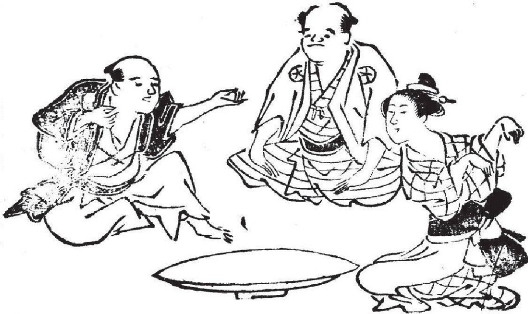
Abbildung 3: N. N.: Illustration der drei Figuren des Fuchs-ken nach dem Genkyoku suibentō (1774), Bd. 1, 4v. Privatbesitz. Rechts die Position des Fuchses, in der Mitte die des Dorfvorstehers und links die des Jägers.

Ken, weshalb das Fuchs-Ken zunächst für den Beobachter viel interessanter ist als die nur mit den Fingern ausgeführten Spiele.