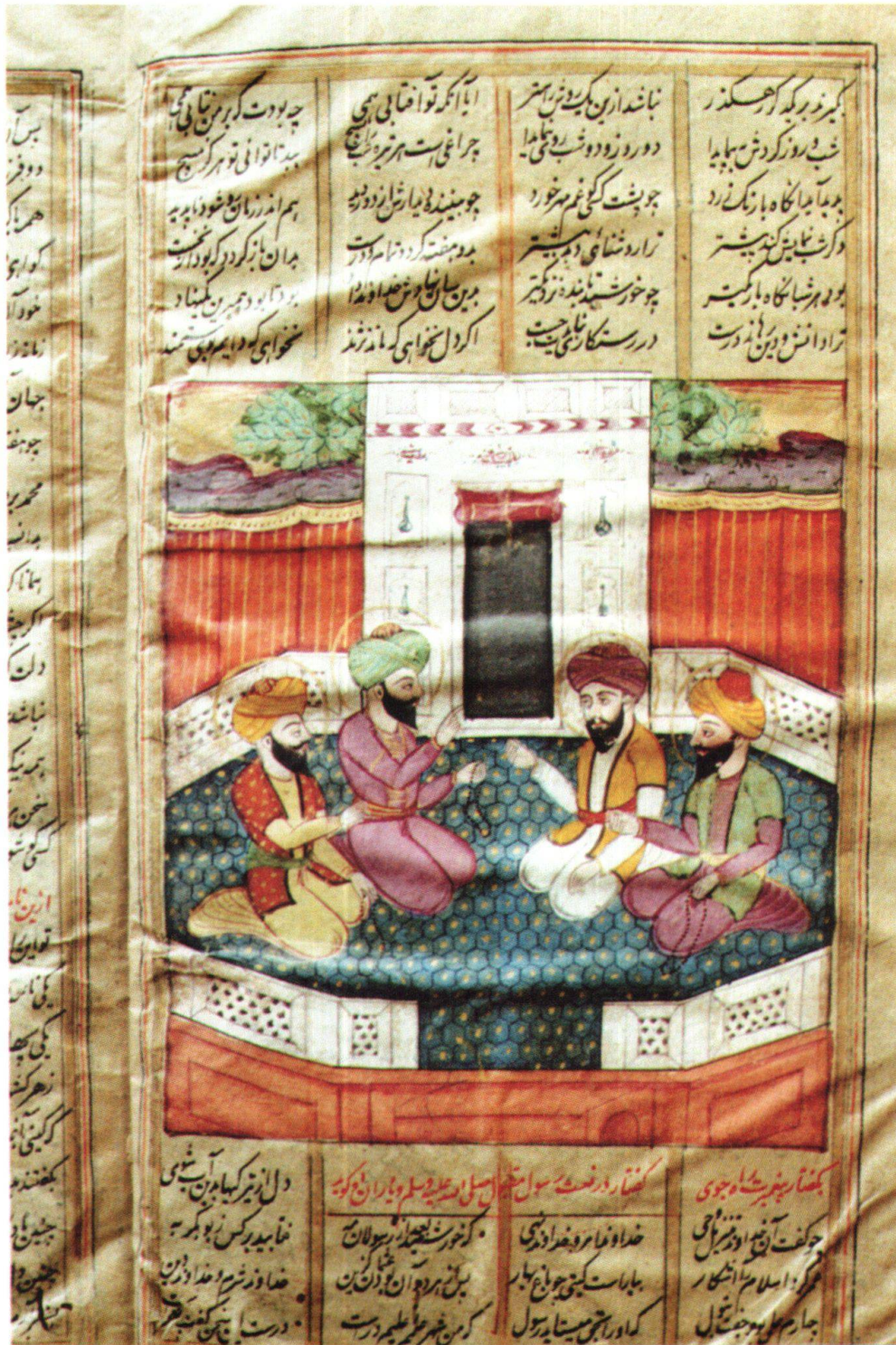
Fig. 5: Ḥolafāy-e Rāšedīn: Abū Bakr, ‘Omar, Oṣmān et ‘Alī. Inde, 1830–1840, Ferdōsī, Šāhnāme , Berne, MHB, cote: M.B. 19, fol. 2v.