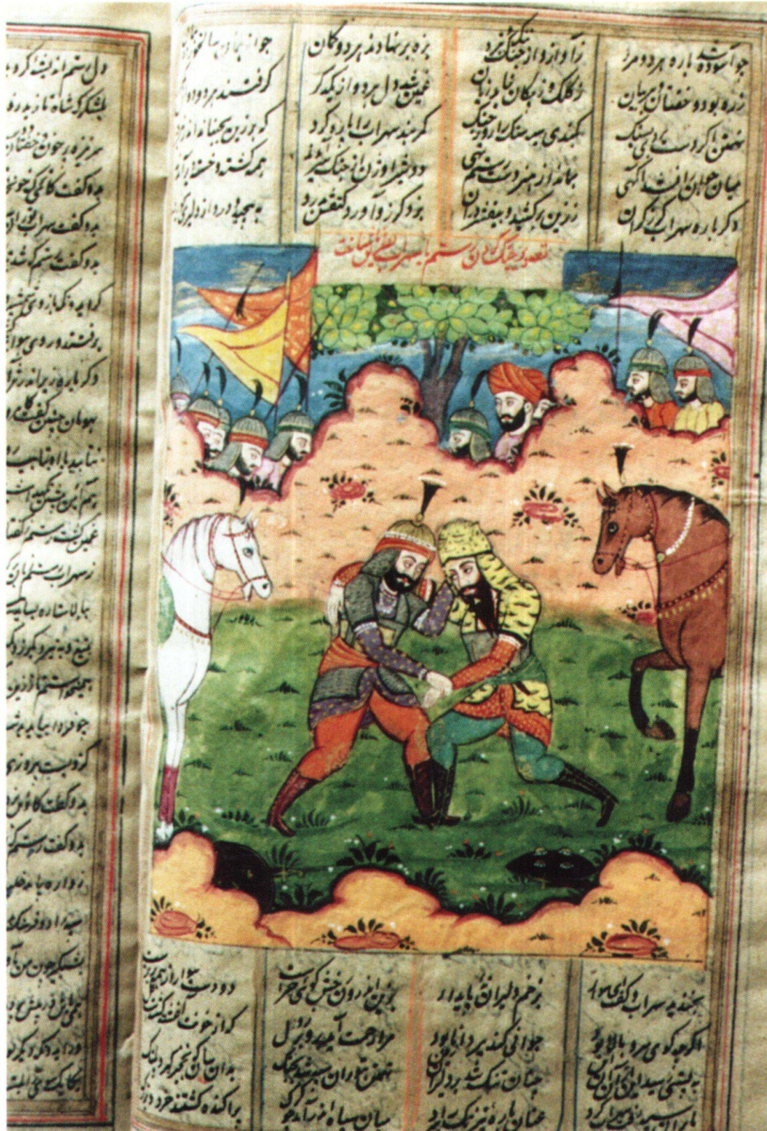
Fig. 9: Le combat entre Rostam et Sohrāb qui ne se reconnaissent pas. Inde, 1830–1840, Ferdōsī, Šāhnāme, Berne, MHB, cote: M.B. 19, fol. 83v.