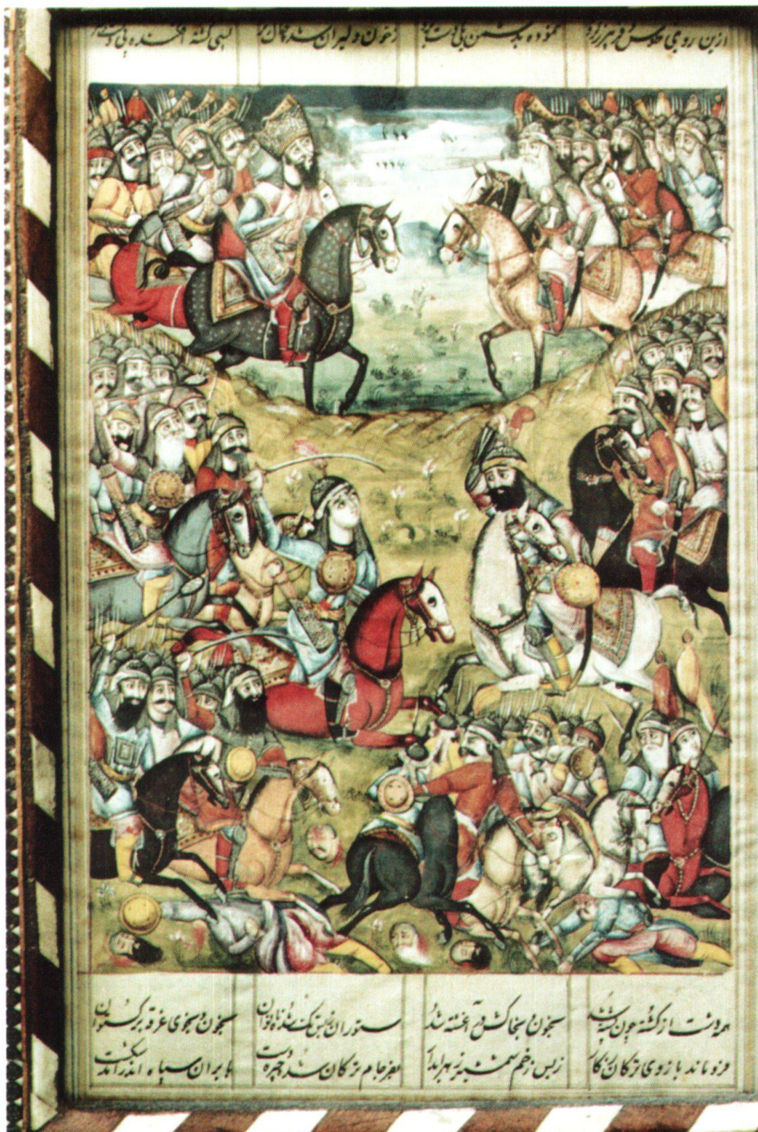
Fig. 4: Kay-Ḥosrō envoie une partie de son armée à la guerre contre l'armée de Tūrān. Iran, 1800–1810, 'Aṭāyī Rāzī, Borzū nāme , Berne, MHB, cote: M.B. 126.