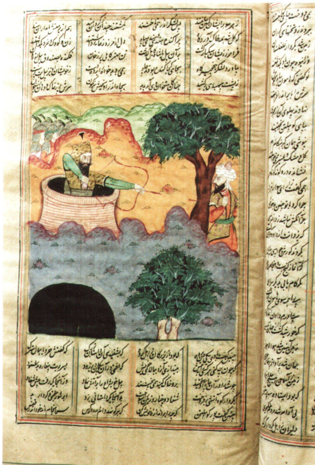
Fig. 12: Rostam dans le piège de Šāgād. Inde, 1830–1840, Ferdōsī, Šāhnāme , Berne, MHB, cote: M.B. 19, fol. 341r.