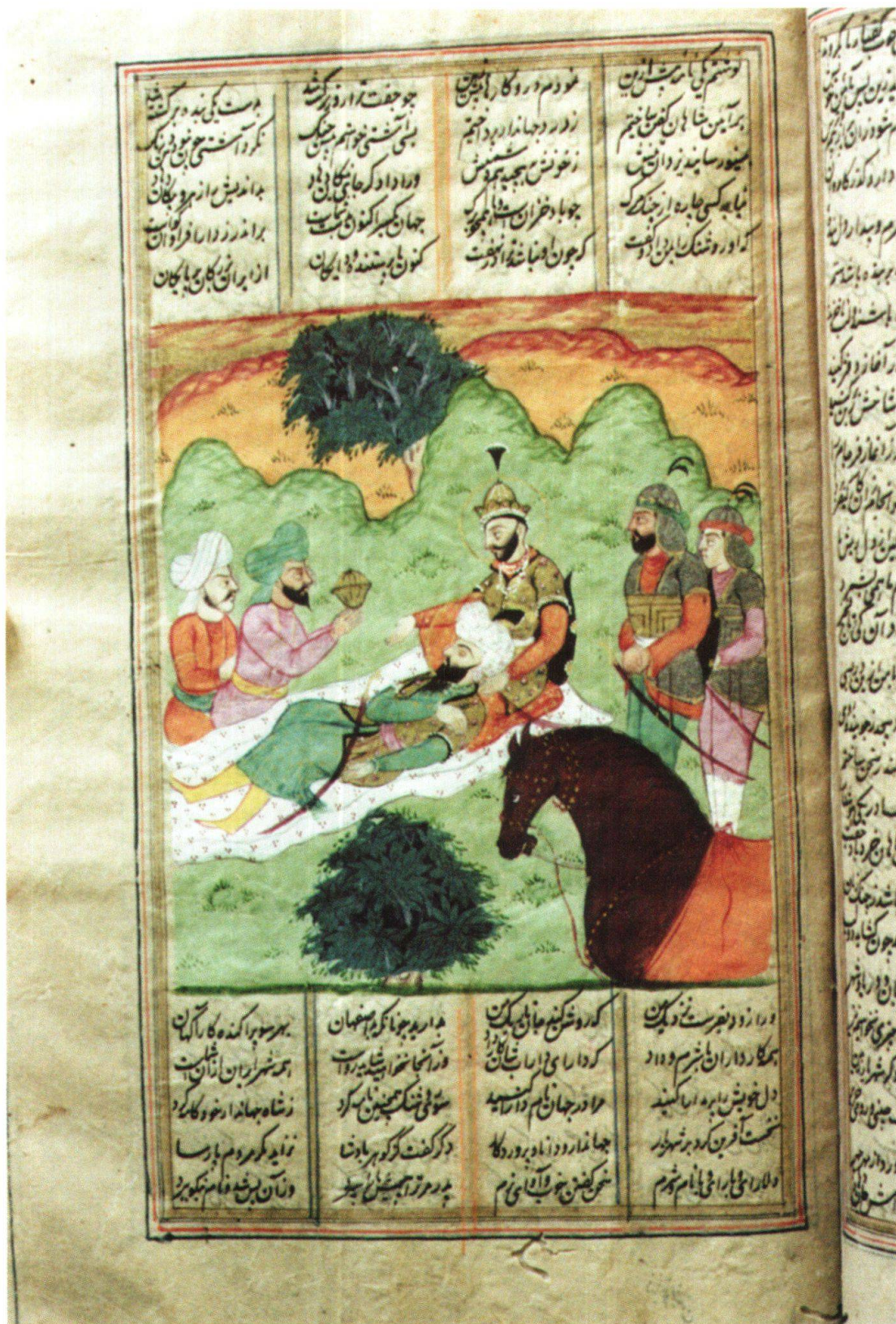
Fig. 13: La mort de Dārā. Inde, 1830–1840, Ferdōsī, Šāhnāme , Berne, MHB, cote: M.B. 19, fol. 359r.