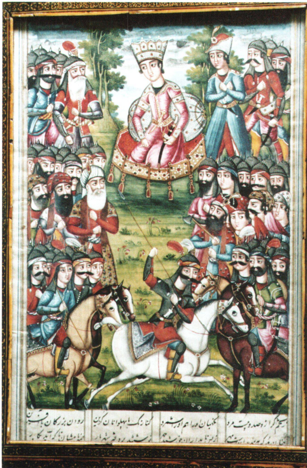
Fig. 2: Défilé de l'armée devant Kay-Ḥosrō. Iran, 1800–1810, Ferdōsī, Šāhnāme , Berne, MHB, cote: M.B. 130.