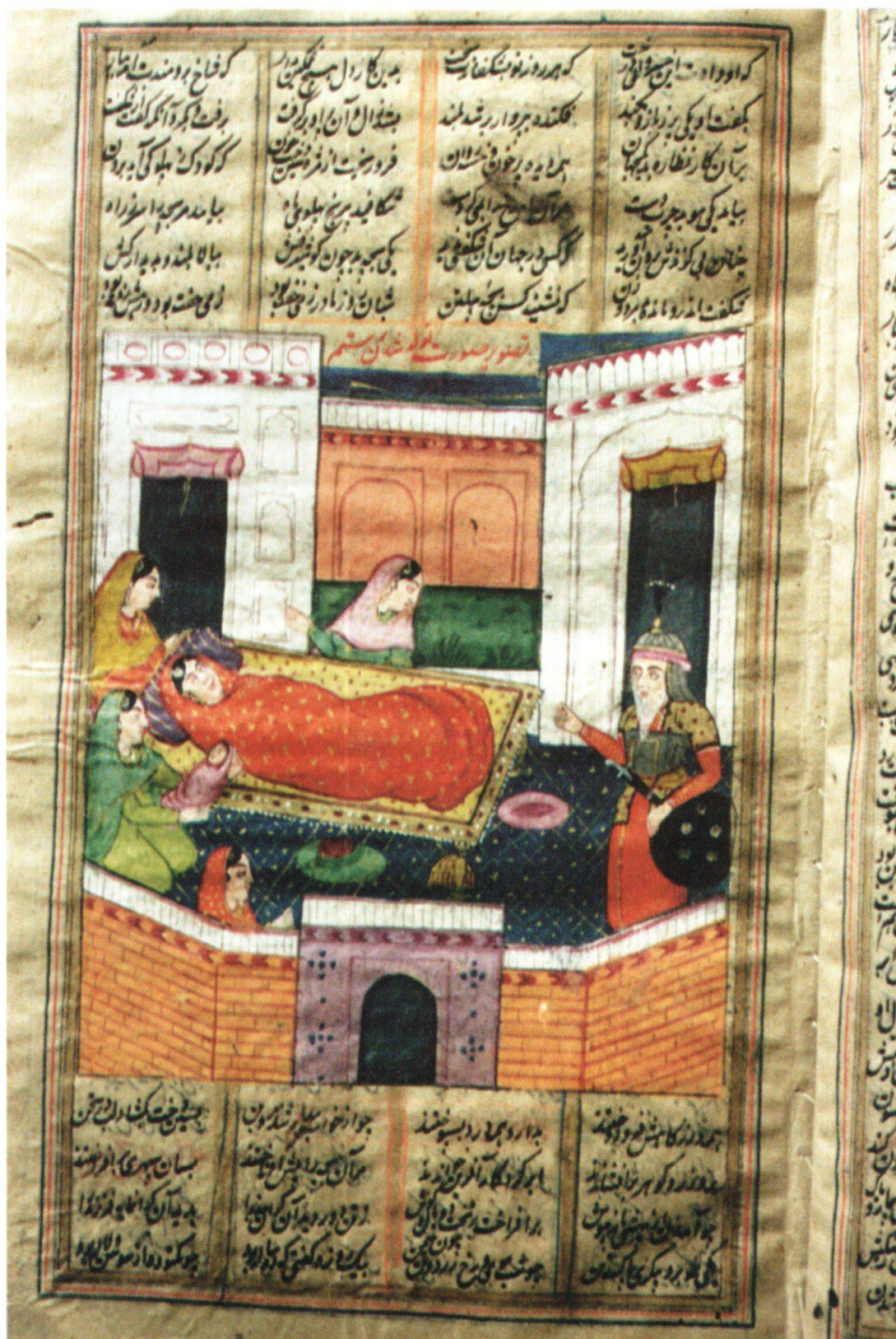
Fig. 7: La représentation de la naissance de Rostam. Inde, 1830–1840, Ferdōsī, Šāhnāme , Berne, MHB, cote: M.B. 19, fol. 42r.