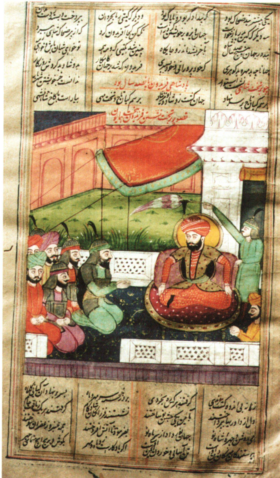
Fig. 6: Fereydūn sur le trône de la fortune. Inde, 1830–1840, Ferdōsī, Šāhnāme , Berne, MHB, cote: M.B. 19, fol. 13r.