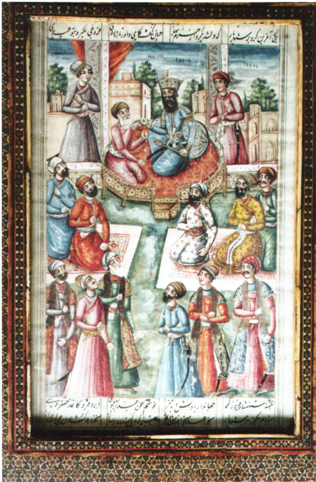
Fig. 3: La discussion entre Būzarǧmehr et le roi Nōšīn-ravān. Iran, 1800–1810, Ferdōsī, Šāhnāme , Berne, MHB, cote: M.B. 127.