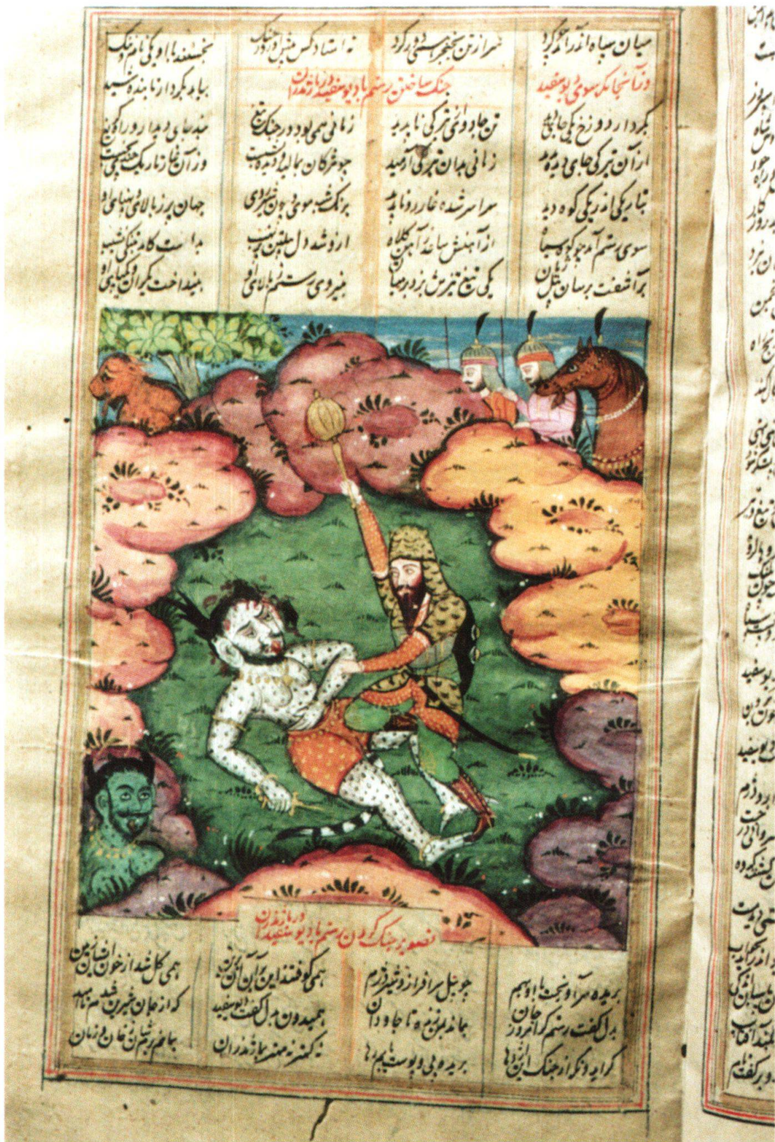
Fig 8: Le combat de Rostam avec le Div blanc à Māzanderān. Inde, 1830–1840, Ferdōsī, Šāhnāme, Berne, MHB, cote: M.B. 19, fol. 63r.