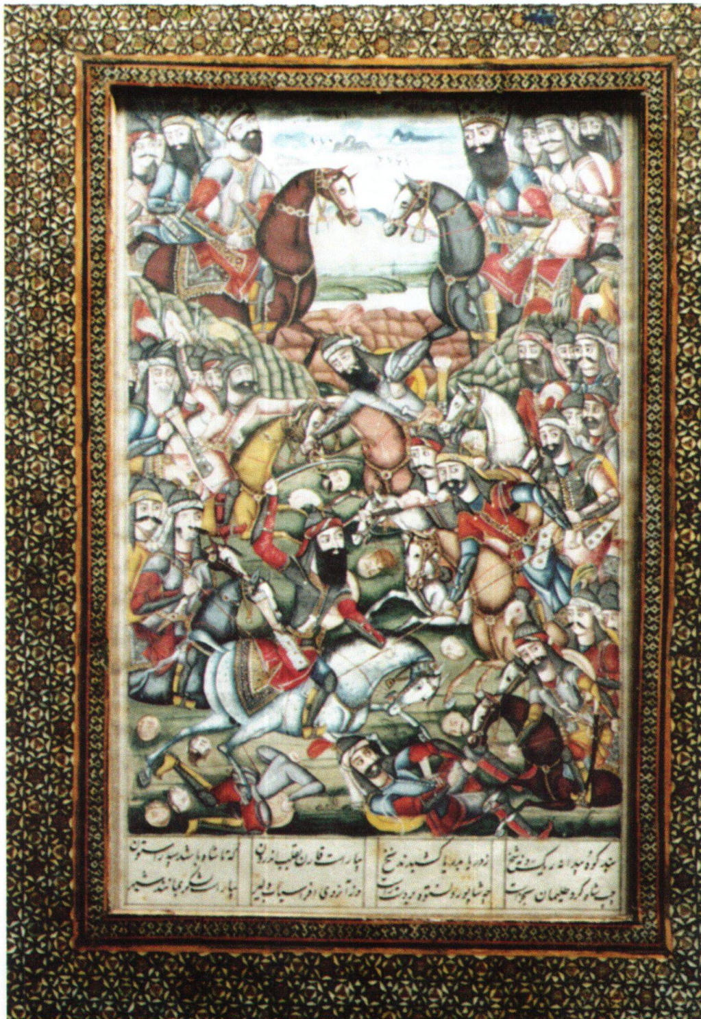
Fig. 1: La guerre du roi Nōzar contre Afrāsiyāb. Iran, 1800–1810, Ferdōsī, Šāhnāme , Berne, MHB, cote: M.B. 128.