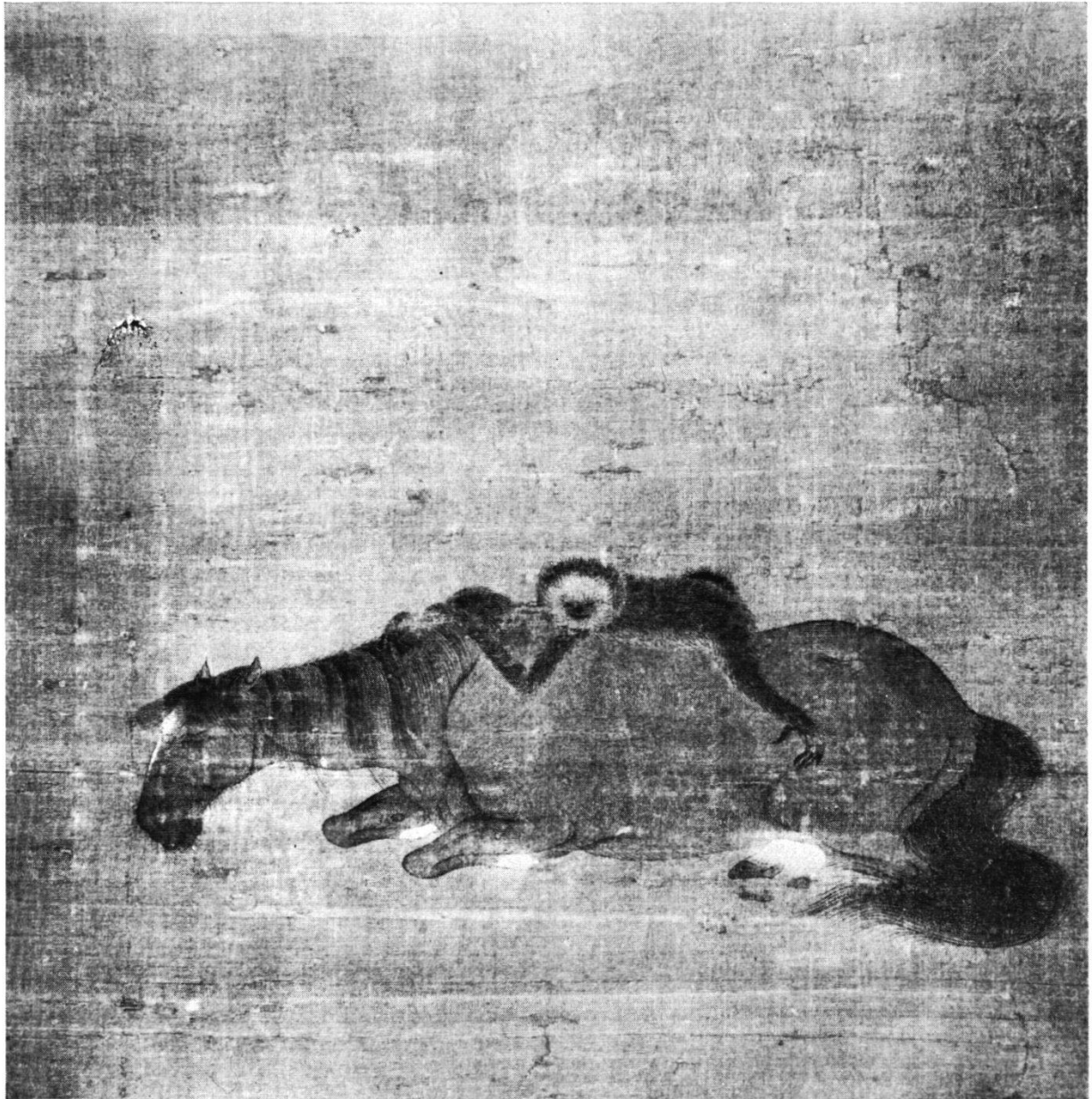
Gibbon sur le dos d'un vieux cheval. (Epoque Song?) Honolulu Academy of Arts.