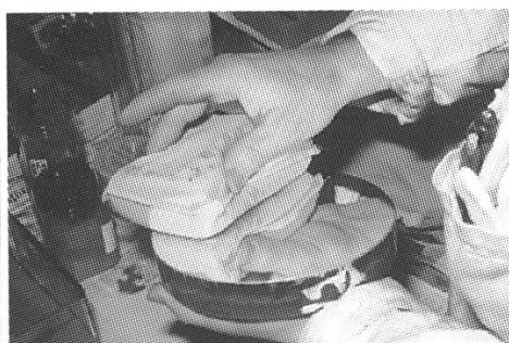
Versilberung – Reflexionsbe- schichtung selbst gemacht.