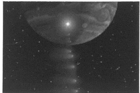
Auf Kollisionskurs – Das tra- gische Ende eines Kometen.