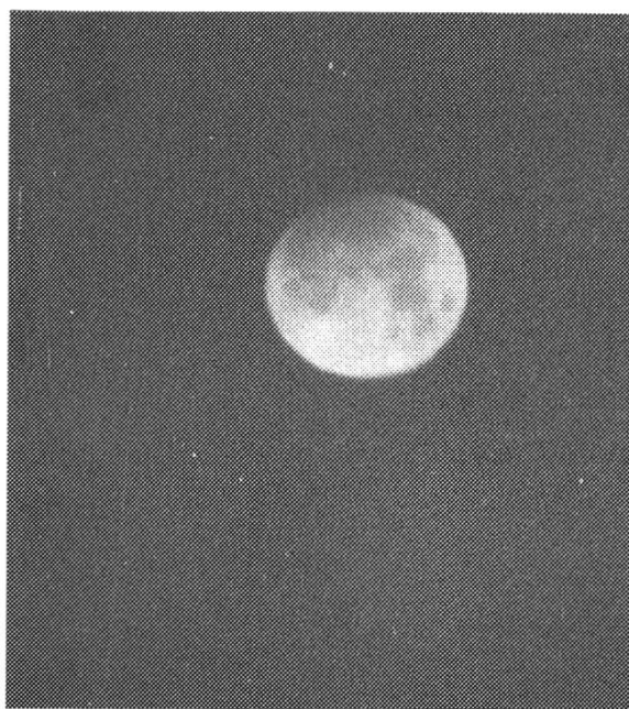
Abb. 1: Auf dem Chasseral konnte die beginnende partielle Mondfinsternis vom 15. Juni 1992 ohne Horizontprobleme und bei klaren Sichtverhältnissen mitverfolgt werden. Fotografie des Mondes im Erdhalbschatten um 05:17 Uhr MESZ mit 300 mm, f/5.6.

überstrahlt waren, funkeln jetzt geheimnisvoll im Hintergrund des finster werdenden Nachbarn. Genau 7 Minuten nach Tageswechsel beginnt die 75 - minütige Totalität. Es würde mich keineswegs verwundern, wenn die für eine Mondfinsternis charakteristische kupferrote Verfärbung dieses Mal ausbliebe. Die gigantische Stratosphärenwolke des im Juni 1991 explodierten Vulkans Pinatubo dürfte nämlich für eine zusätzliche Abschwächung des langwelligen (roten) Sonnenlichtes sorgen, welches auf Umwegen