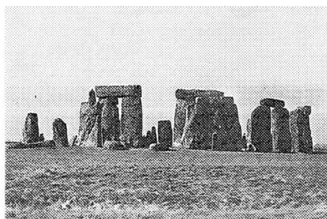
Vom Altertum bis Kopernikus – die Entwicklung des Weltbildes.