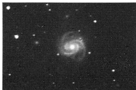
Virgo-Haufen – Besuch im Galaxienparadies.

Pferdekopfnebel am 10.9.1991 (4.05 – 4.13 Uhr) mit Schmidt-Kamera 220/258/454 auf Kodak TP 6415 (Hypersensibilisiert).