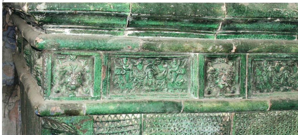
Abb. 2 und 3 Die Ofenkacheln im Stil der Spätrenaissance stammen aus der Zeit zwischen 1550 und 1650. Der Fries besteht aus zwei Kacheltypen mit Grotteskenmasken. Die Füllkacheln zeigen ein Relief mit Wabenmuster. Die Eckkacheln enden oben und unten in einer Muschel.