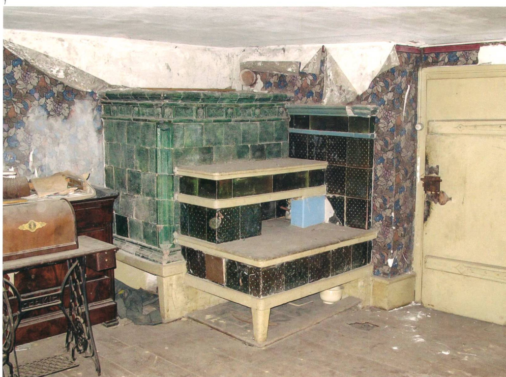
Abb. 1 Metzerlen, Burgstrasse 2. Der Kachelofen mit der Kunst steht im hinteren Anbau des Hauses. Der Kunstofen mit den schablonierten Kacheln stammt aus der ersten Hälfte des 19. Jahrhunderts.

In der Stube an der nördlichen Aussenmauer und neben der Küche steht ein rechteckiger Kastenofen mit grün glasiertem Reliefdekor; davor und daran angebaut ist ein zweistufiger Kunstofen aus dem 19. Jahrhundert. Aufmerksamkeit zieht vor allem der Kastenofen auf sich, doch weiss man nicht, woher seine Kacheln stammen und wann er hier aufgesetzt wurde. Der Fries des Ofens besteht aus zwei sich abwechselnden Kacheltypen, beide ausgestattet mit einem Groteskendekor mit Masken oder Maskaronen. Groteske Ornamente gehören zum Fundus