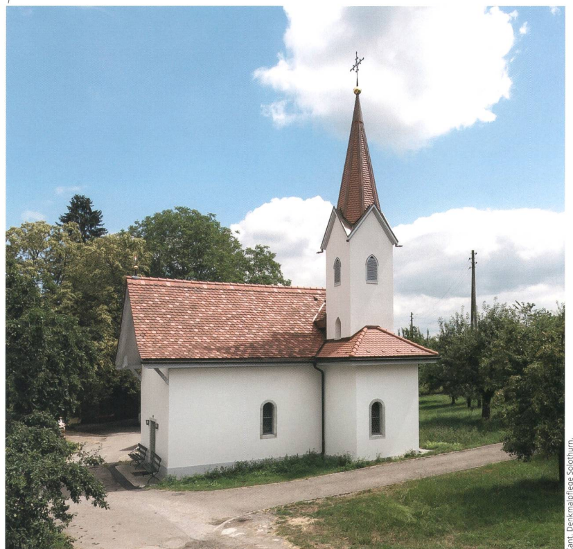
Abb. 1 Aeschi, Marienkapelle in Steinhof, Kirchgasse 11. Die in unverfälschter Um- gebung stehende Kapelle nach der Restaurierung von 2015–2018.

einrichten. Andere gläubige Steinhöfer schenkten ihm Land und halfen beim Bau der Kapelle, die die schwarze Madonna angemessen beherbergen würde. Heute gilt die Kapelle mit ihrer Madonnenfigur als Kraftort. Sie wird regelmässig aufgesucht, um zu beten, Kraft zu tanken und Einkehr zu üben. Damit ist sie ein Ort, der seit seiner Erschaffung besucht, geschätzt und gepflegt wird. Er hat Anteil am und im Leben vieler Menschen.