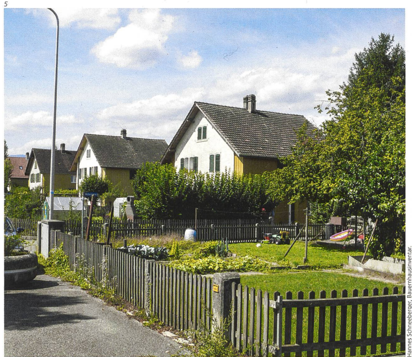
Hannes Schneeberger, Bauernhausinventar.

auf bei den Gartensanierungen im Besonderen zu achten ist und wie die spezifischen Qualitäten des «Elsässli» trotz Bodenaustausch erhalten werden können. 4