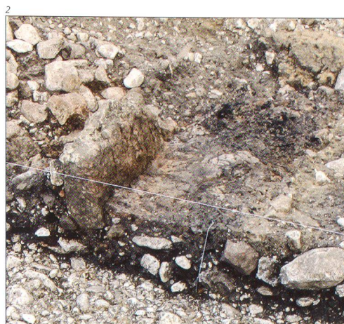
Abb. 1 Büsserach / Galgenhurst. Jungsteinzeitliche Pfeilspitze mit abgebrochener Spitze. M 2:1.

Wegen eines Bauprojektes untersuchten wir im Sommer und im Herbst 2010 eine 1200 Quadratmeter grosse Fläche westlich der Mittelstrasse. Dabei kamen fünf Grubenhäuser sowie Pfostenlöcher von mindestens zwei weiteren Häusern zutage. In einer dieser Bauten fand sich eine Herdstelle; in einem der Grubenhäuser legten wir eine Schmiedeesse frei. Dazu kamen etwa 4 Tonnen Schlacken auf einer mächtigen Deponie, die durch eine Steinsetzung in eine ältere und eine jüngere Phase unterteilt war. Die Bauweise der Grubenhäuser und die Schichtabfolge sprechen für eine mehrphasige Besiedlung, die sich über einige Jahrhunderte erstreckte: Neben einem Grubenhaus-Typ mit Eckpfosten, der ab dem