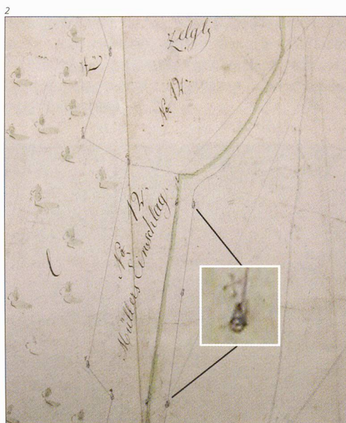
Abb. 2 Auf einem Katasterplan aus der ersten Hälfte des 19. Jh. sind östlich von «Müllers Einschlag» zwei Marchsteine mit einem Tatzenkreuz eingezeichnet.