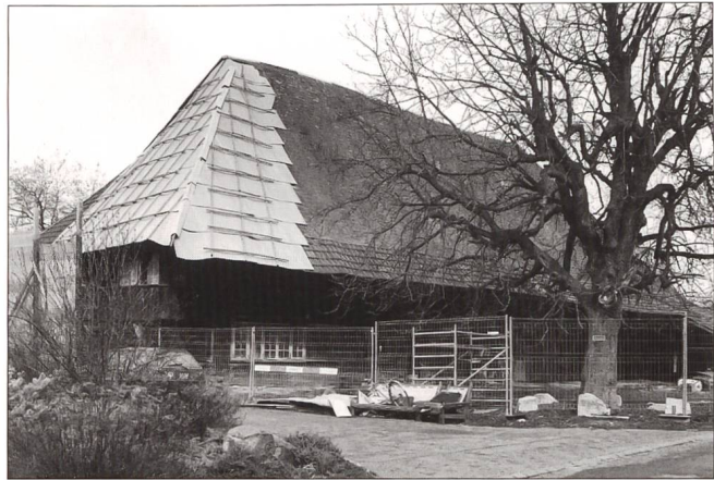
Abb. 2 Zuchwil, Gasserhaus, Ansicht von Südwesten 1998.