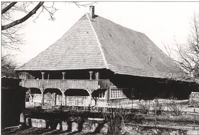
Abb. 1 Zuchwil, Gasserhaus, Ansicht von Südwesten 1976.