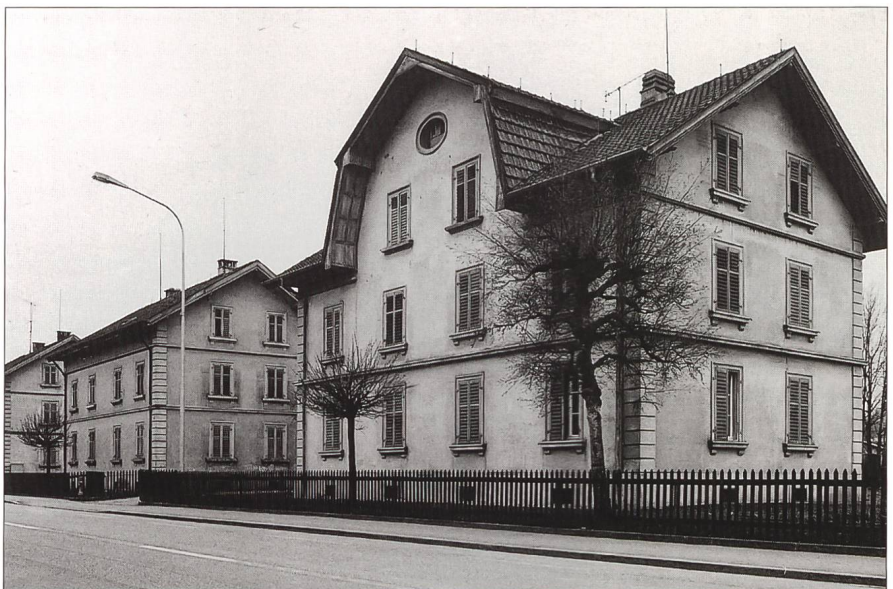
Abb. 1, 2 Gerlafingen, Biberiststrasse 17–29, Arbeiterhäuser von Roll-Werke vor dem Abbruch.

anmutendes Ensemble, das sich einerseits durch die markante Stellung entlang der Biberiststrasse, andererseits durch die einheitliche architektonische Gestaltung der Bauten auszeichnete. Die zweigeschossigen Baukörper