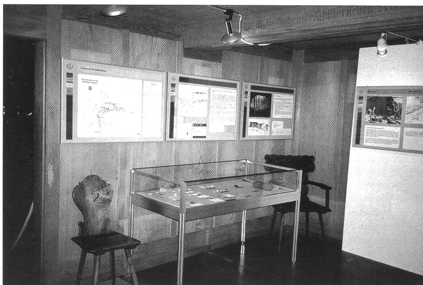
Abb. 3 Ein Blick in die Ausstellung «Feuerstein bis Goldmünzen» im Heimatmuseum Alt Falkenstein in Balsthal, April–Oktober 2000.

Am 3. und 4. November 2000 organisierten wir in Solothurn die Jahresversammlung der ARS, der Arbeitsgemeinschaft für die Pro-