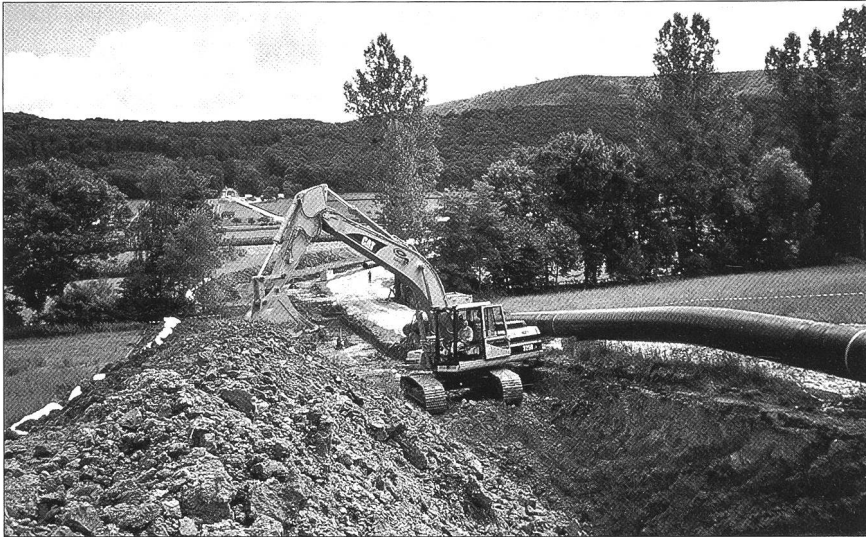
Abb. 2 Aushubarbeiten an der Transitgasleitung Rodersdorf-Lostorf bei der mittelalterlichen Wüstung Biedersdorf, westlich von Rodersdorf.

motivierend wirken musste, braucht wohl kaum besonders betont zu werden.