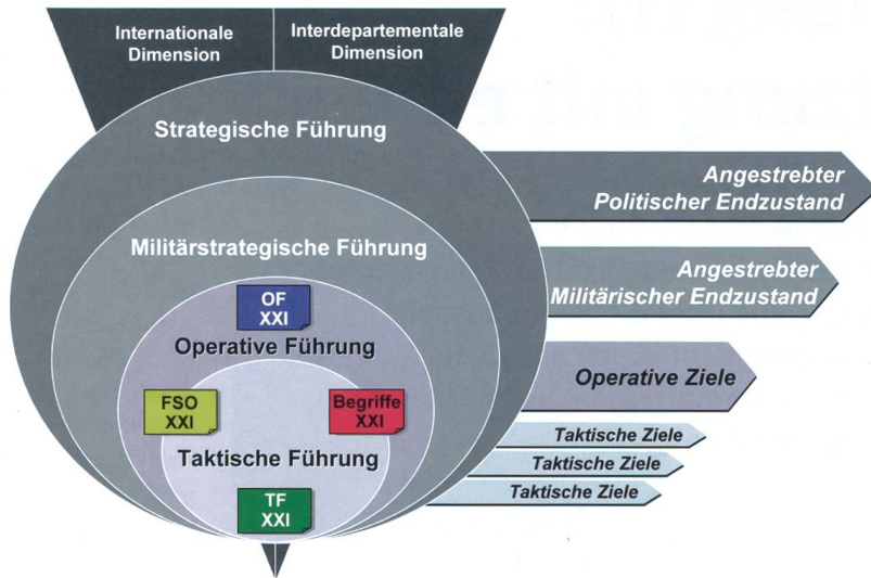
Systematik der Führungsstufen in ihrem Kontext; Grundlage für die Führungsreglemente Armee XXI. Grafik: VBS