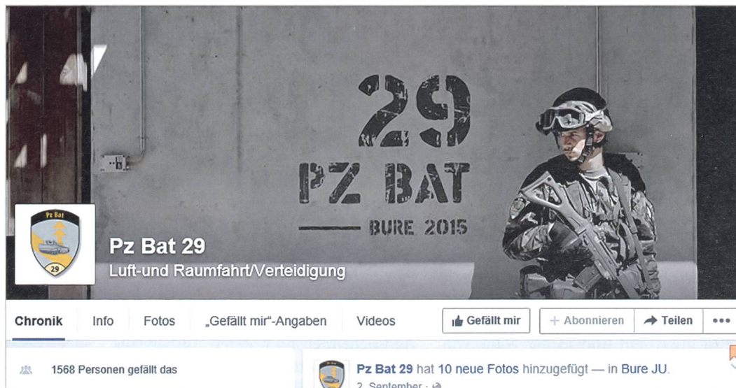
Die Facebook-Startseite des Panzerbataillon 29.

Einzelne Filme sind so gut angekommen und sind über 300 Mal geteilt wor-