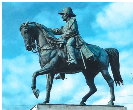
Reiterstatue des Generals in Genf.