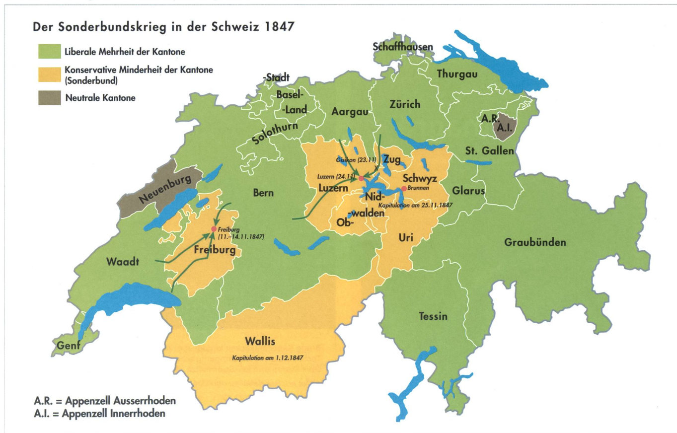
Sonderbundskrieg.