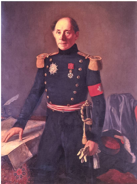
Général Guillaume-Henri Dufour