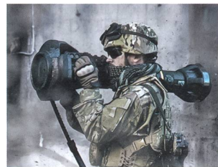
NLaw beim Abschuss.

Mit der NLaw verfügt ein Soldat über die Möglichkeit, jedes gepanzerte Fahrzeug zu neutralisieren. Die rückstossfreie, schultergestützte Panzerabwehrwaffe kann ein Ziel von oben herab bekämpfen, was insbesondere den Einsatz in überbautem Gelände erlaubt. Die 12,5 kg schwere Waffe verfügt über eine Reichweite von 20–600+ Metern, ist wartungsfrei und unter allen Klimabedingungen einsetzbar. Mit einer Lebenser-