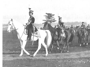
Militärparade in Japan 1933.

für das Land entwickeln soll. Im April 2014 erfolgte die Erleichterung der Restriktionen für Rüstungsexporte und -Importe. Einige Beobachter Ja-