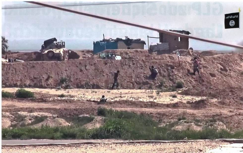
Operation des IS bei Kirkuk (liveleak, aus einem Propagandafilm des IS).

Die IS-Propaganda verspricht den Neuankömmlingen, unter ihnen ganze Familien aus dem Westen, ein islamisches Utopia, das funktionierende staatliche Strukturen, Wohlstand mit einer konservativ-islamischen Lebensführung des 7. Jahrhunderts vereint. Tatsächlich ist es dem IS gelungen, durch die Bekämpfung der ärgsten Korruption und die Bereitstellung staatlicher Dienstleistungen unter der sunnitischen Bevölkerung eine gewisse Un-