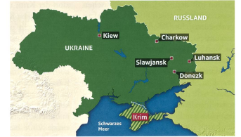
Die Brennpunkte.

5. Der Konflikt eskaliert – ohne direkte Intervention Russlands: Die prorussischen Separatisten erhalten aus Russland wei-