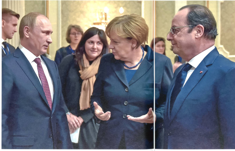
Während den Verhandlungen zu Minsk II; Putin, Merkel, Hollande.

tere Waffen und Munition in grösserem Ausmass und geben ihren bewaffneten Kampf nicht auf. Ein komplexer Orts- und Häuserkampf ist die Folge. Guerillaaktionen werden verstärkt durchgeführt. Die Lage destabilisiert sich zunehmend mit einer steigenden Anzahl von Opfern unter der Zivilbevölkerung. Die Regierung in Kiew ist nicht in der Lage, die Herrschaft mit eigenen Mitteln wieder herzustellen. Der Osten bewegt sich in Richtung eines andauernden Bürgerkrieges. Russland hält sich aus direkten bewaffneten Auseinandersetzungen heraus, wird für die Unterstützung der Rebellen mit zusätzlichen Sanktionen belegt.