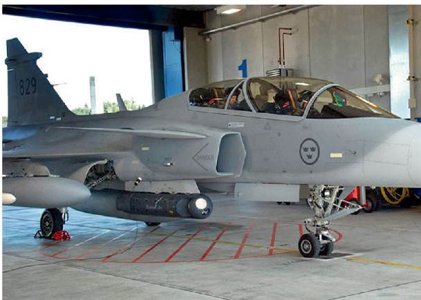
Gripen D mit Aufklärungspod.

Seit der Einführung 1965 der Mirage III RS hat sich die Technologie beachtlich verändert. Ausser im Zusammenhang mit dem inzwischen ebenfalls veralteten Aufklärungsdrohnensystem ADS 95 verfügt die Luftwaffe über kein nennenswertes Wissen mehr im Bereich Luftaufklärung. Drohnen können aber die bemannte Luftaufklärung nicht ersetzen. Unbemannte Luftaufklärung mit Drohnen und bemannte Luftaufklärung mit Kampfflugzeugen ergänzen sich in idealer Weise. Drohnen zeichnen sich durch eine äusserst lange Verweildauer, permanente Aufklärungsleistung und minimalste Lärmentwicklung aus. Sie sind in Verteidigungsoperationen aber auf ein permissives Umfeld angewiesen, in welchem idealerweise die Luftüberlegenheit errungen wurde oder mindestens eine vorteilhafte Luftsituation