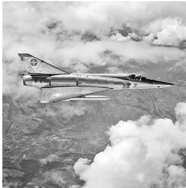
Mirage III RS.

teln Informationen über zugewiesene Räume und Objekte zu Gunsten von zivilen Führungsstäben und/oder militärischen