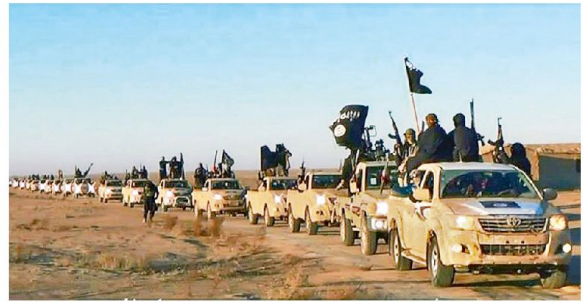
Weit mehr als Einzeltäter: Ein Konvoi von organisierten IS-Kämpfern.

Damit stellt der Islamische Staat eine eigenständige Form dar. Äusserste Brutalität, wirksamer Einsatz der Verbindungsmittel und junge Soldaten – wie eine zweite Generation der Al Qaida – sind die Zutaten für seine Vorstösse in den letzten Monaten. Allerdings wäre der Aufstieg des IS ohne die Allianz mit den sunnitischen Stämmen im Irak, die durch den früheren Regierungschef Nouri al Maliki angespornt wurden, ungleich schwieriger gewesen. Schützenhilfe haben auch mehrere andere konkurrierende islamistische (Jabhat al Nosra, Ahrar al Chaam) und nicht islamistische (Freie Syrische