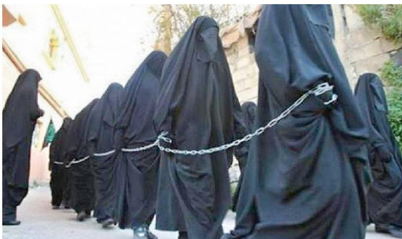
Sex-Dschihad: Der IS zeichnet sich durch rücksichtslose Gewalt aus.