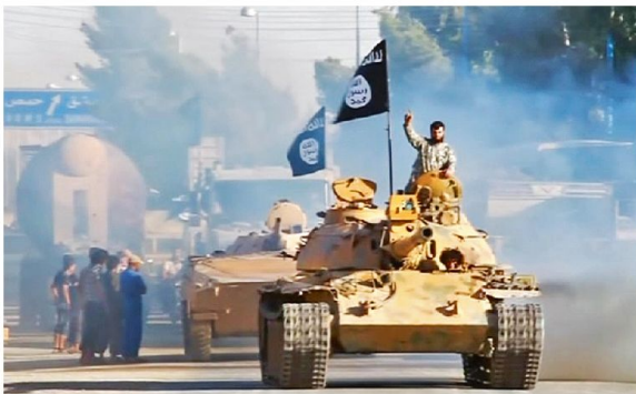
Der IS verfügt über schwere Waffen.