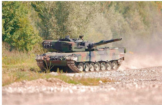
Pz 87 Leopard WE.

Optiken) und Führungssystemen (Funk, Battlefield Management Systems). Der internationale Trend geht in diesem Bereich eindeutig in Richtung der vollständigen Digitalisierung des Gefechtsfeldes, was einerseits viele Vorteile bringt (hohe optische Auflösungen, automatische Zielerkennung und -verfolgung, taktische Lagedarstellungen), aber gerade im Rahmen der Verteidigung auch unangenehme Abhängigkeiten schafft. Insbesondere der Einsatz von Netzwerk- und Satellitentechnologie (GPS) zur Navigation und