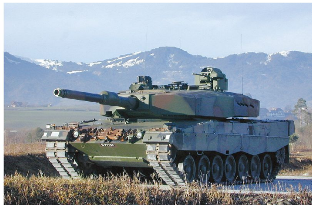
Pz 87 WE, Prototyp 1 mit Zusatzschutz und autarker Waffenstation, 2003.

metall und damit praktisch baugleich mit der Waffenanlage des Pz 87) und dass auch in Deutschland mit dem Leopard 2 A7+ als Option wieder das kurze Rohr einführt werden soll. Während eine Vergrösserung des Kalibers aus verschiedenen Gründen momentan auch international