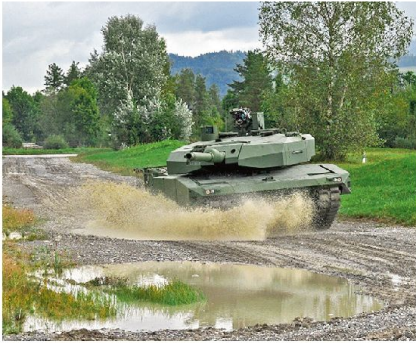
Technologiedemonstrator Leopard 2 MLU (Mid-Life-Upgrade), RUAG Defence (2012).

re im Einsatz bleiben soll. Mit Ausnahme vielleicht der Türkei und Südkorea, welche jeweils sehr viel Geld in die Entwicklung eines neuen Kampfpanzers stecken (Altay & K2), setzt der grösste Teil der Panzernationen auf Evolution statt Revolution!