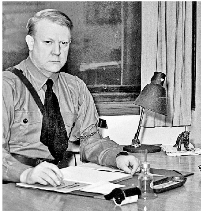
Vidkun Quisling, Synonym für Verrat.

Polen bestehenden alliierten Streitmacht von über 20 000 Mann geschaffen. Sie eroberte zusammen mit der 6. norwegischen Division Carl Gustav Fleischers (1883–1942) am 28. Mai 1940 die Stadt Narvik zurück und drückte den von etwa 5000 zu gleichen Teilen aus Gebirgsjägern und angelandeten Matrosen zusammengesetzten Verband von Eduard Dietl (1890–1944) bis in die unmittelbare Nähe der schwedischen Grenze zurück. Dann aller-