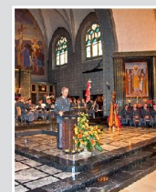
Promotion des GLG II/13