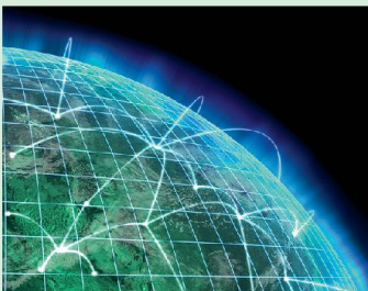
18 Neue Risiken im virtuellen Raum