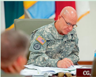
12 Generalmajor McMaster