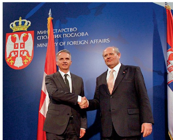
BR Burkhalter und Serbiens Aussenminister Ivan Mrkic besprechen am 12. Februar 2013 in Belgrad den OSZE-Vorsitz.

Wir haben unserem Vorsitz ein Motto gegeben: «Eine Sicherheitsgemeinschaft im Dienste der Menschen schaffen». Damit sprechen wir in einem Satz unsere