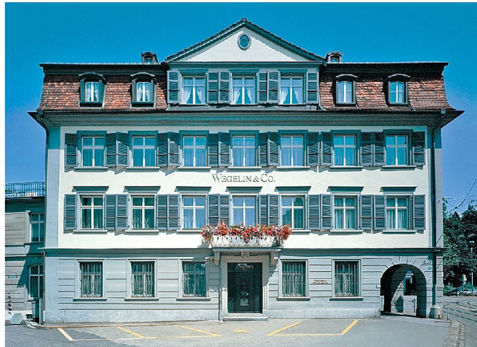
Hauptsitz der früheren Bank Wegelin in St.Gallen

Die Befürworter der Lex USA und die Wortführerin Bundesrätin Widmer-Schlumpf argumentierten, dass mit diesem Schritt gegenüber den USA endlich Ruhe einkehre. Nach Einschätzung von Experten würden Bussen an die USA in der Höhe von rund zehn Milliarden Franken fällig, dieser Ablass und Aderlass sei für die Banken tragbar. Gegner der Lex USA widersprachen mit der Feststellung, die USA hätten noch nie Ruhe gegeben. Sie würden über kurz oder lang wieder mit neuen Forderungen auftreten, und es liege im Wesen von Erpressungen, dass sie eine Fortsetzung fänden. Die schlimmste Gefahr bestehe darin, dass andere Länder dasselbe von der Schweiz fordern würden. Beispiels-