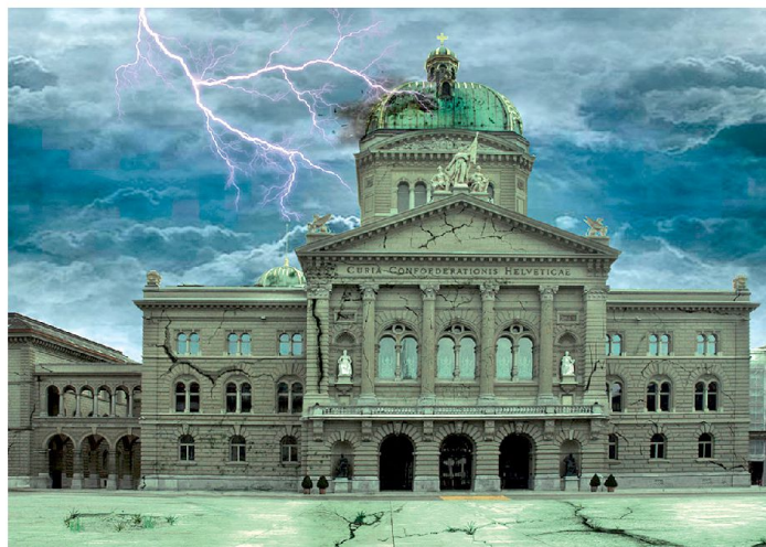
Im Gewitter ausländischer Mächte: Widerstand oder Unterwerfung?

Der pauschale Vorwurf der USA und die pauschale Forderung an die Schweiz lauten: Die Schweizer Banken haben nicht versteuertes Geld entgegengenommen, die Schweiz hat ab sofort für die USA Steuerpolizei zu spielen.