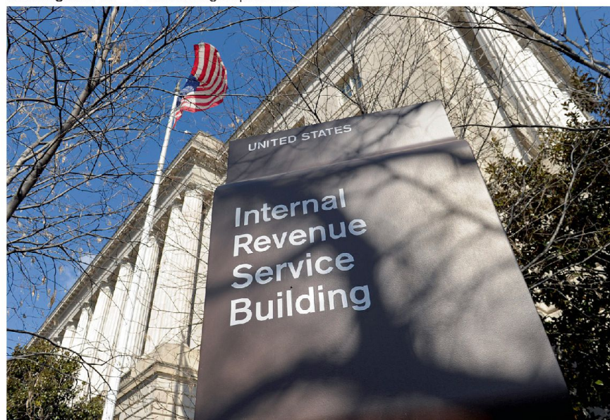
Internal Revenue Service Building, Washington D.C.

Ein gewichtiger Streit entbrannte innenpolitisch in der Schweiz um die sogenannte Lex USA. Mit diesem Gesetzesantrag erreichte der Steuerstreit mit den USA den Höhepunkt. Man stelle sich vor: Ein fremder Staat greift in die Souveränität eines anderen Staates ein, und verlangt, dieser habe ein Gesetz zu erlassen, das für ein Jahr sein Gesetz und Recht ausser Kraft setze, und zwar sofort. Sowohl im Volk als auch im Schweizer Parlament überwog das Gefühl, diesem Unrecht dürfe nicht nachgegeben werden, denn die Schweiz werde von den USA erpresst. Die eidgenössischen Räte lehnten den Gesetzesentwurf des Bundesrates ab. Entgegen schweizerischem Gesetz und Recht hätten Banken für ein Jahr alle Daten über Kunden, Mitarbeiter und Konten an die USA liefern