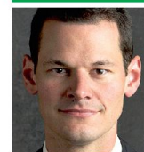
Hptm Pierre Maudet Regierungsrat FDP Vorsteher Sicherheitsdep. Master Rechtswissenschaft 1200 Genève