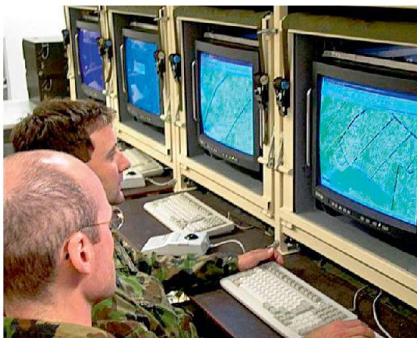
Feuerführungszentrum auf Stufe Brigade.

Diese Rechnung lässt sich analog zu anderen Gebieten (Material, Ausbildungspersonal oder Infrastruktur) anhand von vier Schritten qualitativ und quantitativ durchführen und anschliessend in verschiedenen Stressszenarien testen. Weil wir nicht vor einer unmittelbaren Bedrohung stehen und weil die