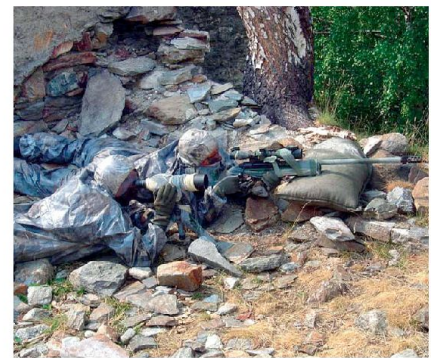
Scharfschützentrupp mit Beobachter und Schütze.