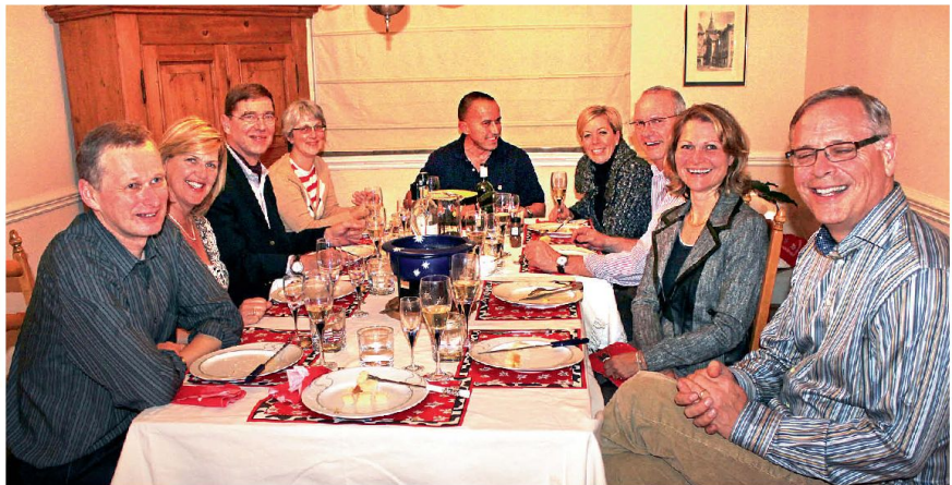
«Swiss Evening» mit dem französischen General Stéphane Abrial, Kommandant ACT.

In meinem Pflichtenheft als Partner National Liaison Representative (PNLR) im NATO Hauptquartier hatte ich folgende Hauptaufgaben: